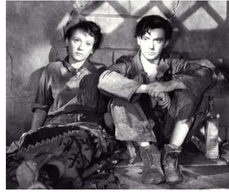
KEP A VALAHOLO EUROPÁBAN CÍMŰ FILMBŐL