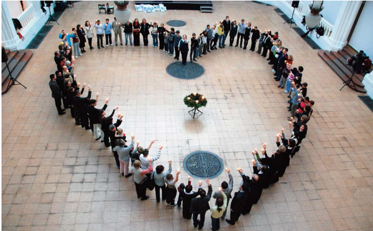
Óriás „élő szívvel” kívánta felhívni a figyelmet az összefogás fontosságára a Magyar Ökumenikus Segélyszervezet múlt vasárnap az Iparművészeti Múzeum aulájában, az országos adventi adománygyűjtő kampány nyitórendezvényén.

Melléklet: Útitárs – magyar evangéliumi lap