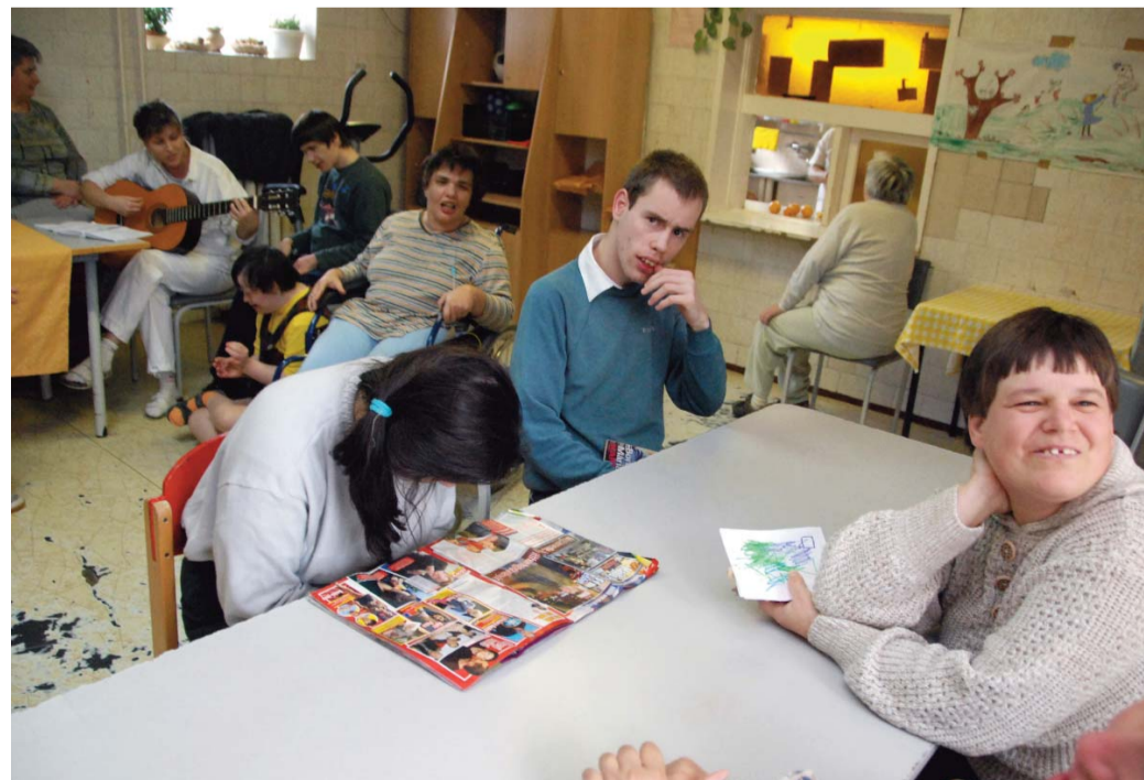
Ebéd utáni szieszta