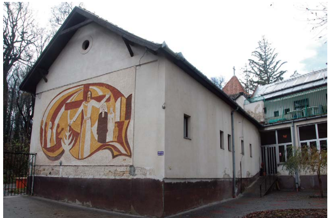
A Sarepta Báthori utcai épületszárnya

– Hát ezért szeretnénk új épületet fogyatékos lakóinknak – mondja az elmúlt tíz év próbálkozásait és kudarcait soroló igazgató lelkész, aki legfrissebb terveikkel kapcsolatban elárulja, hogy jelenleg „Nagykovácsiban gondolkodnak”. – Egy új otthon felépítéséhez persze