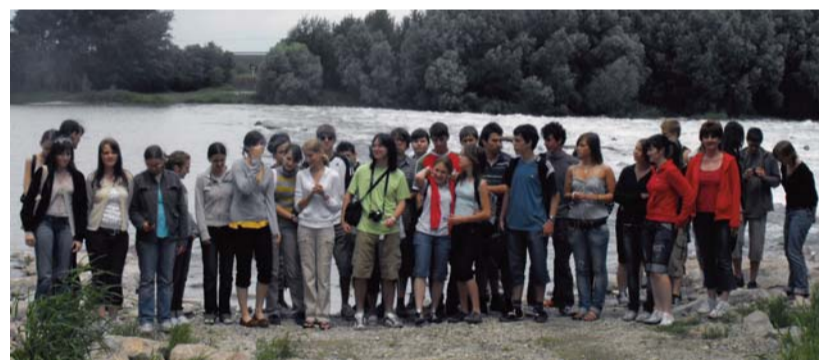
Látogatás a bős–dunakiliti vízerőműnél

Iskolai közösségünk a szervezéssel és vendéglátással járó feladatokat szeretettel, örömmel és fegyelmezetten hajtotta végre. Az EGOT tovább erősítette bennünk az együvé tartozás jó érzését. A találkozó résztvevőitől rengeteg jó szót, hálás köszönetet kapunk még ma is. Ezekből idézünk a találkozó mottójának szellemében: „Örömmel sokszorozódjék a te örömödben, hiányosságom váljék jósággá benned.” (Weöres Sándor) (A levélrészletek ezen az oldalon keretben olvashatók. – A szerk.)