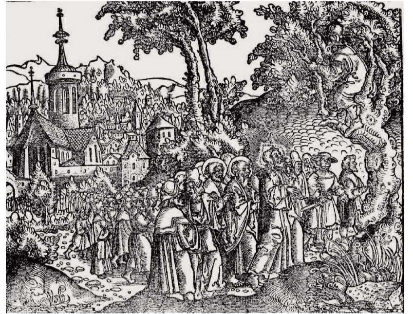
Zákus találkozása Jézussal – 16. századi metszet

A szerző megemlíti Zákus példáját is, akit eleven bűnbánata és határozott akarata arra indított, hogy jóvátegye hamisságát (Lk 19,1-8). Erre Jézus válasza: „ Ma lett üdvösséged ennek a háznak (...). Mert azért jött az embernek Fia, hogy megkeresse és megtartsa, ami elveszett. ” (Lk 19,9-10) Az ember megtérésének legvilágosabb példája a Jézus lábainál ülő bű-