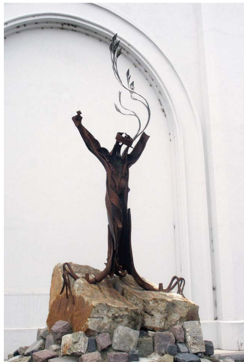
A váci börtön előtt látható 56-os emlékművet 2006-ban állították annak emlékére, hogy 1956. október 27-én több száz politikai foglyot szabadított ki a forradalom

mára, és győztesként kerültünk-e ki belőle? Semmiképpen sem volt megsemmisítő a vereség, ha meggondoljuk, hogy utána Magyarországot nem lehetett többé úgy kormányozni Moszkvából, mint addig. Talán még az ellenforradalom legsivárabb, legsötétebb napjaiban sem. Ha másért nem, azért, mert a nemzet önmagára ismert. Tíz napig nem kellett hazudozni, és a tíz nap alatt mindenki megértette, hogy az ország lakosságának messze túlnyomó többsége számára a kommunista rendszer elfogadhatatlan. Eszelős ideológiai szigorát enyhíteni kellett, míg végre magának a tartományi helytartónak a szájából hangozhatott el az eszmeileg megalkuvó kijelentés, hogy „aki nincs ellenünk, az velünk van”.