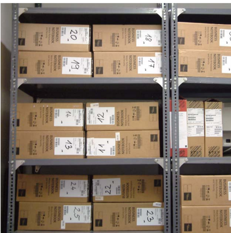
Pályázaton nyert notebookok bevetésre várnak

A plakáton olvasható iskolánk második sikeres Humán erőforrás-fejlesztési operatív program (HEFOP) pályázata. A kompetenciaalapú oktatási programok megvalósításához 9,5 millió Ft-ot nyertünk eszközök beszerzésére. Az elnyert összeg lehetővé tette, hogy interaktív oktatói anyagokat, kompetenciafejlesztő eszköztárat, taneszközöket, hordozható számítógépeket, multimédiás nyelvoktató CD-ket, vizsgatesztelő szoftvereket vásároljunk. A pályázatnak köszönhetően idegen nyelvű kompetenciát fejlesztő nyelvi labort is kialakíthattunk.