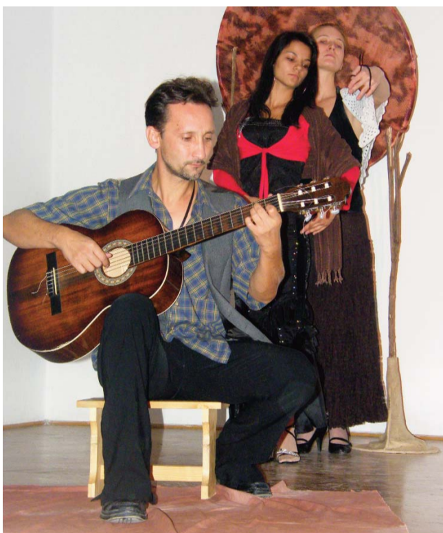
Az Esztrád Színház előadása az október 17-ei budapesti első országos cigánynapon

tő tanoda várja – elsőől hatodik osztályig – a gyerekeket. Ennek keretében segítséget kaphatnak a házi feladatuk elkészítéséhez, illetve szükség szerint van kétség- és képességfejlesztés is. Nagyon szép eredményeket értünk már el: az egyik kislány addig jutott el e téren, hogy a minap olvasott el egyedül egy ifjúsági regényt, majd