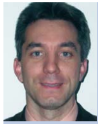
Evangélikus istentisztelet a Magyar Rádióban

Kapi püspök úgy rendelkezett, hogy püspöki szolgálata kezdetének hu-