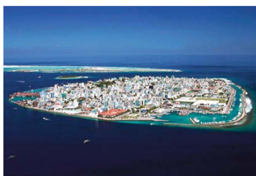
Male, a Maldív-szigetek fővárosa

Hogy mekkora különbség van a gazdagok és a szegények felelőssége között, azt jól mutatja az a vita, amely ezekben a hónapokban Nagy-Britanniában zajlik. Tekintélyes tudósok, köztük Sir David Attenborough természettudós azt állították, hogy az üvegházhatású gázok kibocsátását leghatékonyabban születésszabályozással lehet csökkenteni.