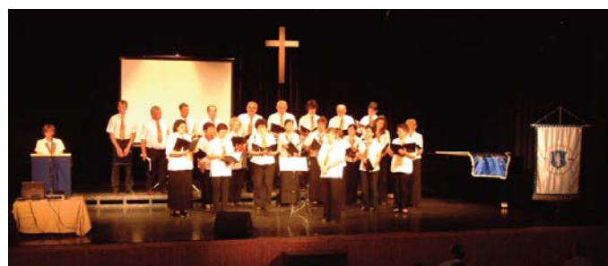
Az oroszországi evangélikus énekkar

tünk. Vagy gazdasági, vagy ökológiai válság uralkodik el rajtunk. A kultúra eredendően azt jelentette, hogy a világot művelni kell, átszellemülten Istenhez emelni. A reneszánsztól kezdve aztán kialakult egy új világ, amelyből Isten hiányzik – fejtette ki. Az Antikrisztus nem tud megtestesülni, hanem rajtunk keresztül cselekszik. „Ha nincs Isten, akkor bankokat és tankokat kell építeni” – gondolta az ember. Őriási technikai fejlődés indult meg a volt keresztény Európában. Magas szinten elégitik ki az emberiség alacsony szintű igényeit. Az előadó megállapítása szerint az életszínvonal megszűntette a lélekszínvonalat.