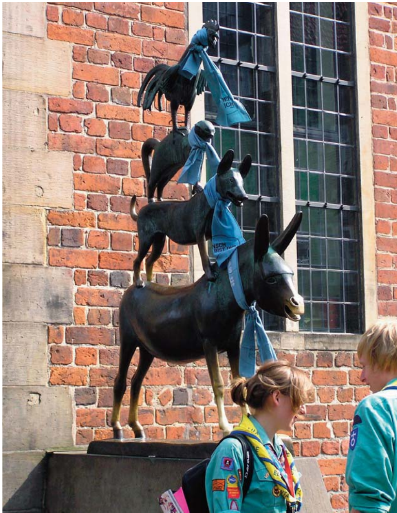
A brémai muzikusok is a Kirchentag kendőjét viselték a nyakukon

„Itt!” – hangzott a kiáltás egyszerre százezer torokból. Ez a rövid szócska (volt) a válasz az idei Kirchentag mottójára. A május 20. és 24. között Brémában megtartott 32. német evangélikus egyházi napok záró istentiszteletén erre a bizonyos „Ember, hol vagy?” (vö. 1MÓZ 3,9) kérdésre zengett a felelet.