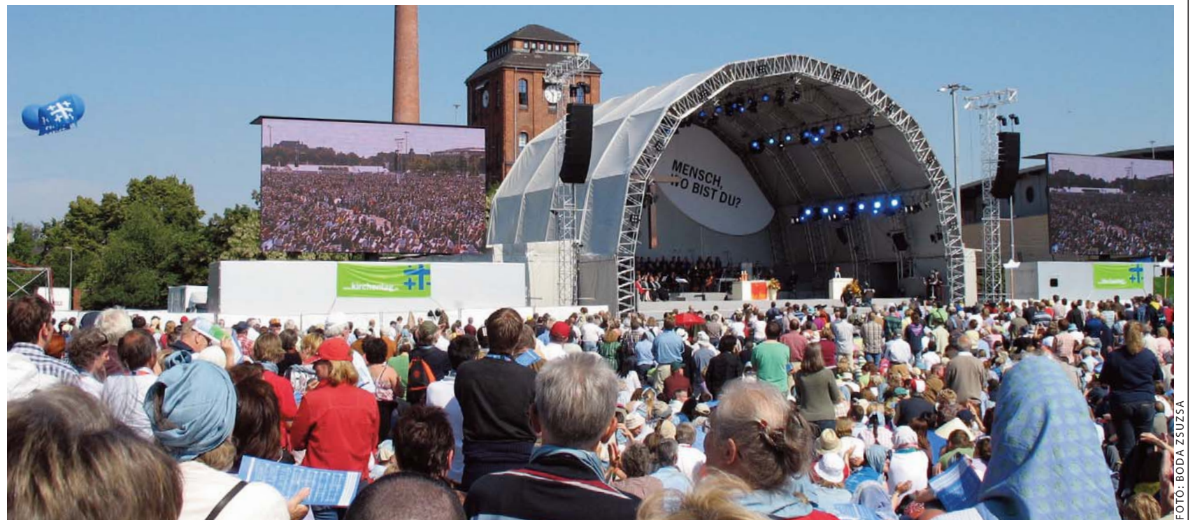
A záró istentisztelet – a kivetítőkön éppen a tömeget pásztázó kamera képe