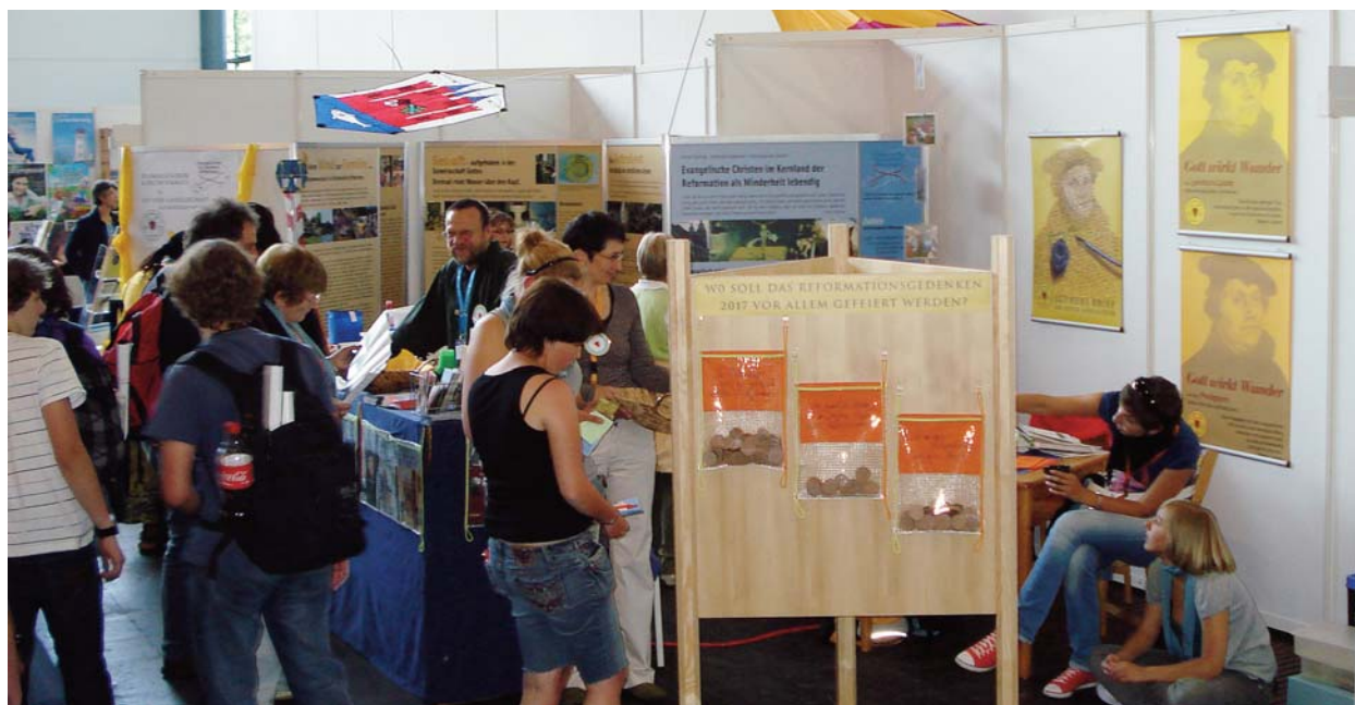
Szavazatgyűjtő zacskók a wittenbergiek standjánál