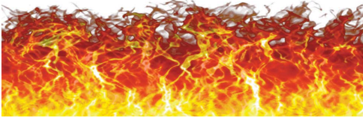
► Mint a szél, a tűz és a mámor... – pünkösdi Égtájoló a 3. oldalon

Ne „papos”, hanem „neves” presbitereket! ► 13. oldal