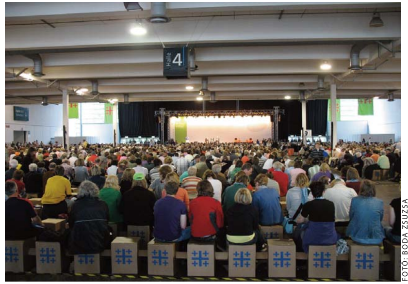
Telt házas pódiumbeszélgetés a vásárcsarnok egyik csarnokában – ülőalkalmatosságként a korábban már jól bevált, Kirchentag-logóval ellátott, újrahasznosítható papírszékek szolgáltak