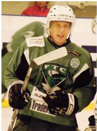
A Ferencváros színeiben

– Négy-öt évig játszottam az NSZE együttesében, de ott megszűnt az én korosztályom. Bár az egész családom erősen Fradi-szimpatizáns volt, tudatosan választottam az Újpestet. Aztán amikor a csapatban különféle gondok jelentkeztek, akkor hívtak