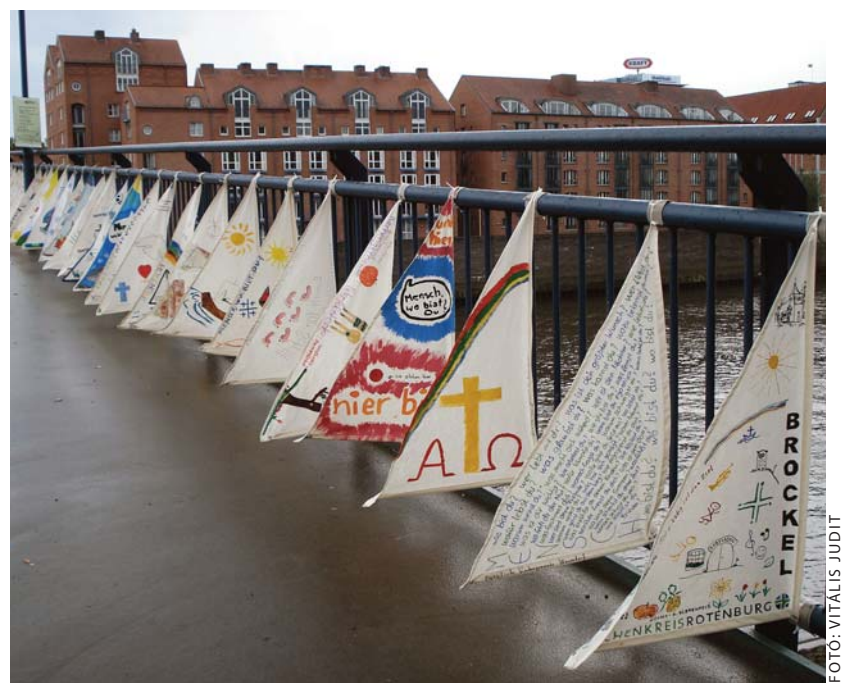
Gyerekek által díszített árbcok a Weser folyó egyik hídján