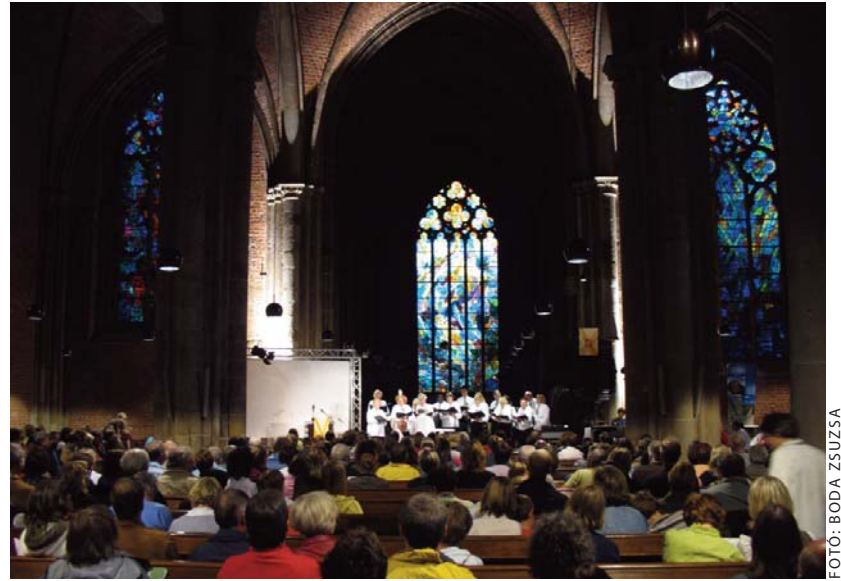
Egyházzenei koncert Bréma óvárosának egyik templomában