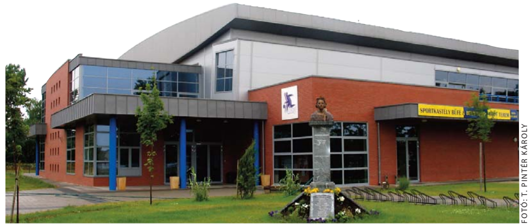
A szeptember 12-i evangélikus presbiteri találkozó majdani helyszíne Pestszentimrén

A tanítás nemcsak az egyház arculatához tar-