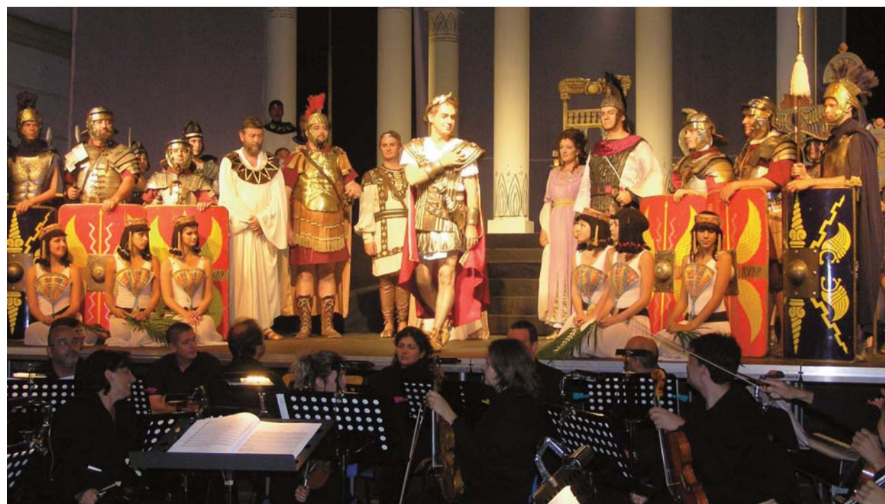
A Julius Caesar szombathelyi bemutatója