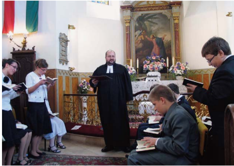
A csömöri evangélikus gyülekezetben két vasárnap zajlik a konfirmáció. Felvételünk a május 3-i konfirmációi vizsgán készült, az ünnepi istentiszteletre e hét vasárnapján kerül sor.