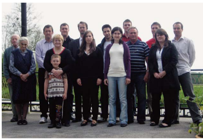
Sebeborci szállásadóink körében

darabbal, verssel, diameditációval, majd rövid áhitatra került sor. Mindezek témája az út, az út Lélektől lélelig, kapcsolatok, összekötő pontok közöttünk. Előadásunkat rögzítette a lendvai televízió, és interjút készített velünk a helyi rádió is.