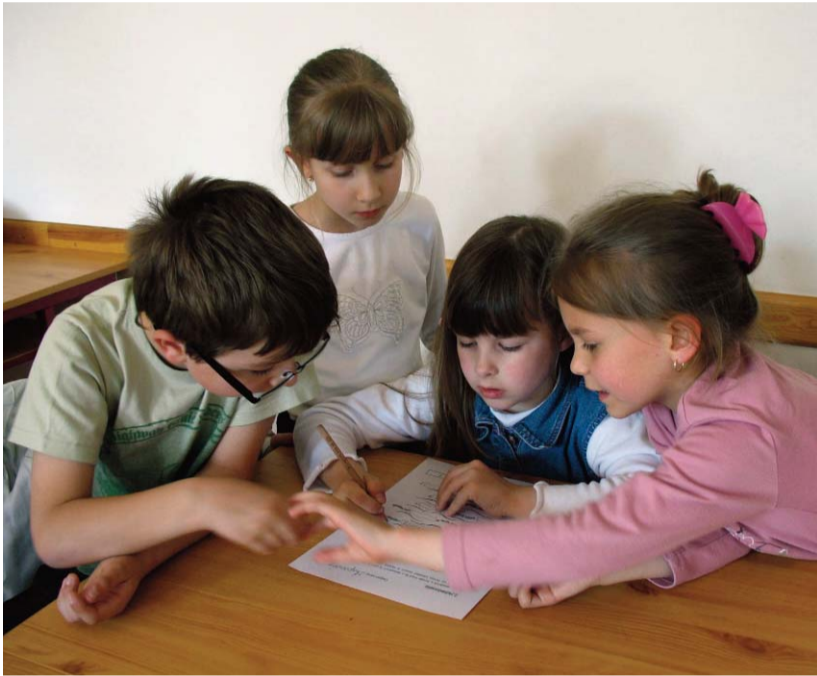
Munkában az 1-2.-os korosztály egyik csapata