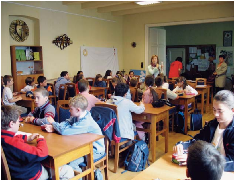
A 3-4. osztályosok a zuglói gyülekezeti teremben