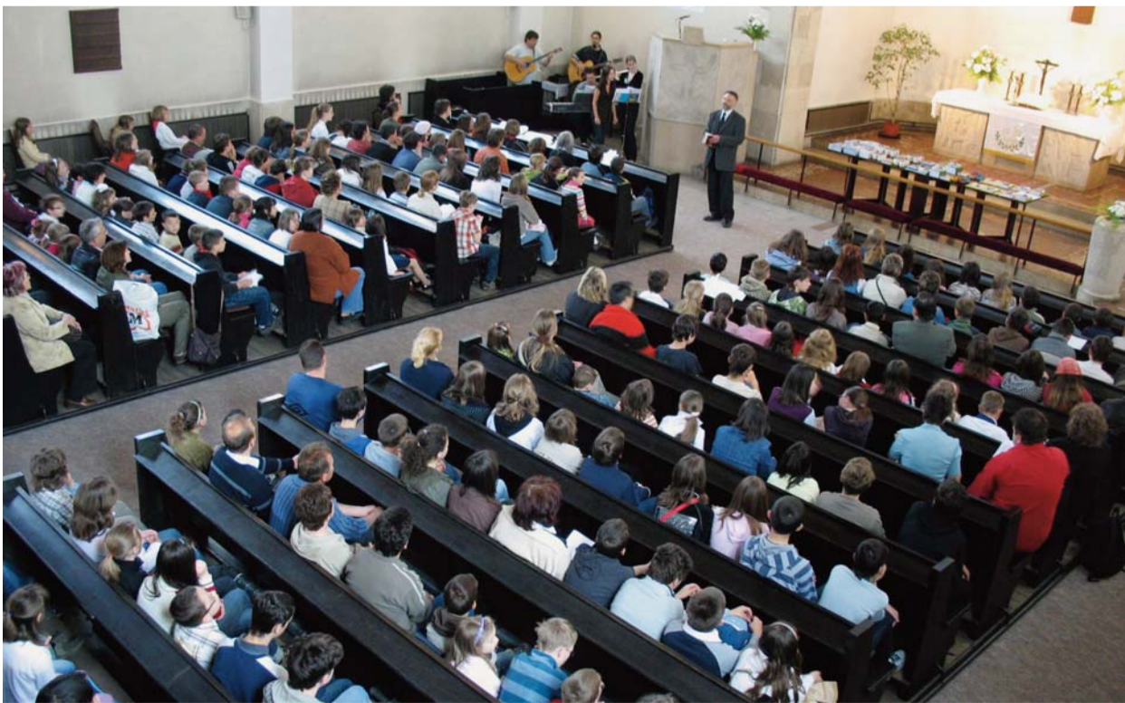
Reggeli áhítat a zuglói templomban