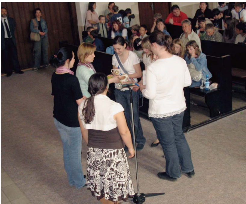
A díjátadás pillanatai