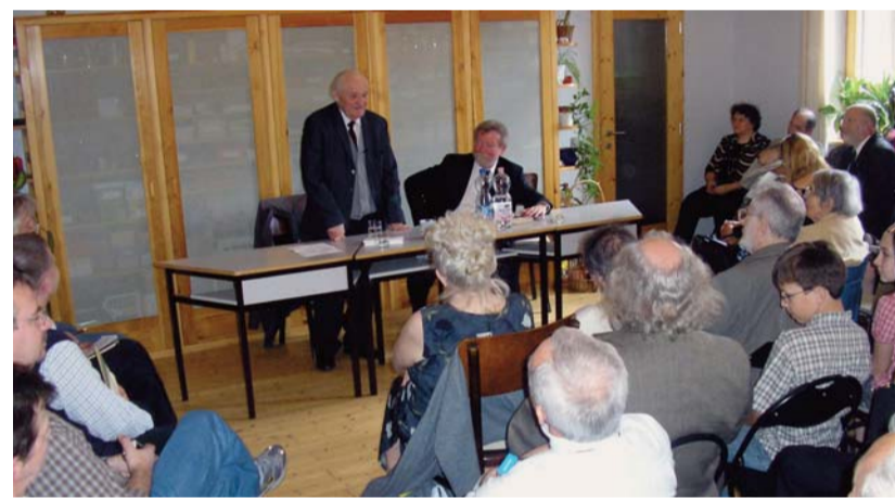
Kányádi Sándor: „Én nem szegény erdélyi menekült vagyok, hanem diplomata”

morral, versidézettel fűszerezett előadásban idézte fel színes élete néhány epizódját, és fogalmazta meg irányadó gondolatait költészetről, anyanyelvről és magyarságról. „A magyar nemzet célja, hogy a csak számára kiválasztott nyelvet továbbvigye és gazdagítsa. Addig önmaga, amíg tagjai magyar nyelven beszélnek, gondolkodnak és művelik magukat” – hangzott Kányádi Sándor, aki a kisebbségi léttel kapcsolatban szövegezte, hogy a nyelv megőrzésében és ápolásában milyen döntő szerepük van az istentiszteleteknek, a színháznak és az író-olvasó találkozóknak. Ugyanakkor megjegyezte, hogy eleve van a „határon túliság” emlegetéséből, mert ez a kifejezés avított és egyben megalázó is. „Én nem szegény erdélyi menekült vagyok, hanem diplomata” – mondtotta a költő.