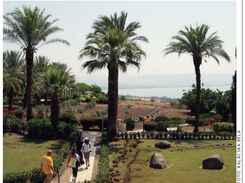
A boldogmondások hegyoldalán

regély István érsek, sőt a szabadegyházak küldötte is. Itt jegyzem meg, hogy bár az 1991. július 18-án államilag regisztrált egyházas-kulturális civil szervezetté nyilvánított Ökumenikus Tanulmányi Központ nem utazási iroda, alapszabálya ugyanakkor lehetővé teszi zarándokutak szervezését. Az isteni gondviselés mindvégig gondoskodott hozzáértő és mélyen hívő érdeklődőkről, így a kezdetben nagy kétséggel fogadott elgondolás életképesnek bizonyult, és változatlanul az mind a mai napig.