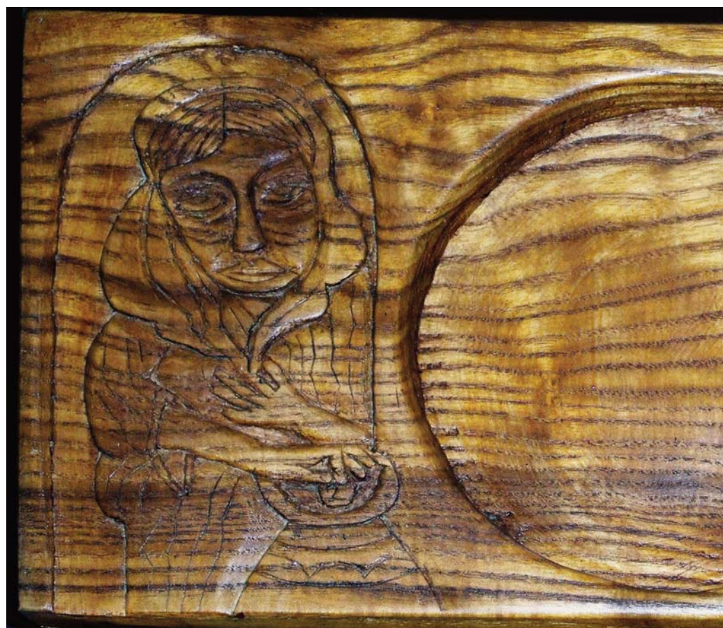
RADICS BÉLA: SZEGÉNY ASSZONY KÉT FILLERE (PERSENTYÁNYÉR, GALGATYÓKI EVANGÉLIKUS TEMPLOM)

Ó, Uram! Amikor ott ülök életem perselyeinél, és látod, mit adok abból, amim van, akkor pontosan tudod, hogy milyen sokszor én is csak a fölöslegből adok. Milyen sokszor elfelejtkezem arról, hogy semmim sem lenne, ha nem kapnék tőled erőt és segítséget földi céljaim és sikereim eléréséhez. És én úgy hálálom ezt meg, hogy előbb mérlegre teszem a pénzemet, az időmet és a lehetőségeimet, majd csak annyit áldozok belőlük az ügyedre, amennyit épp nem sajnálok. Bocsáss meg érte!