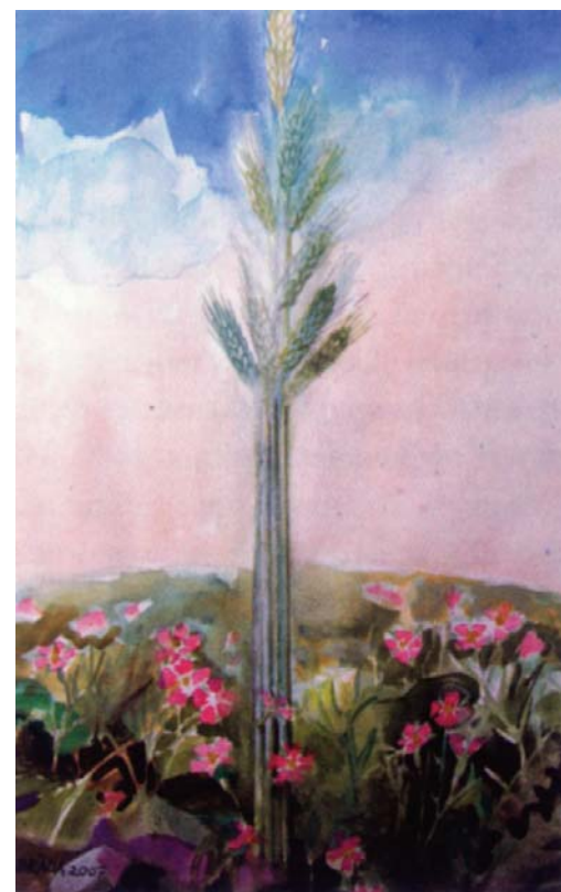
BRADA TIBOR: A BÚZA ÉS A KONKOLY

Más helyen így tanított Jézus: „Hasonló a mennyek országa ahhoz az emberhez, aki jó magot vetett a szántóföldjébe. De amíg az emberek aludtak, eljött az ellensége, konkolyt vetett a búza közé, és elment. Amikor a zöld vetés szárra szökött, és már magot hozott, megmutatkozott a konkoly is. A szolgák ekkor odamentek a gazdához, és azt kérdezték tőle: Uram, ugye jó magot vetted a földedbe? Honnan van akkor benne konkoly? Ellenség tette ezt! – felelte nekik. A szolgák erre megkérdezték: Akarod-e, hogy kimenjünk, és összeszedjük a konkolyt? Ő azonban így válaszolt: Nem, mert amíg a konkolyt szednétek, kiszaggatnátok vele együtt a búzát is. Hadd nőjön együtt mind a kettő az aratásig, és az aratás idején megmondom az aratóknak: Szedjétek össze először a konkolyt, kössétek kévébe, és égessétek el, a búzát pedig takarítsátok be csűrőmbé.” (Mt 13,24–30)