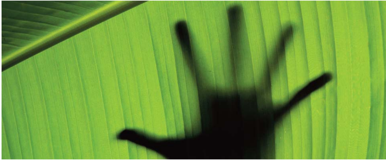
Virágvasárnapról húsvétig – nagyheti összeállításunk a 8–9. oldalon

„Együtt a bajban” ► 4. oldal Két miért között ► 7. oldal Nagyheti gondolatok ► 8–9. oldal Kereszt-utak ► 11. oldal Sízsímet – másképpen ► 12. oldal Húsvét felé ► 12. oldal