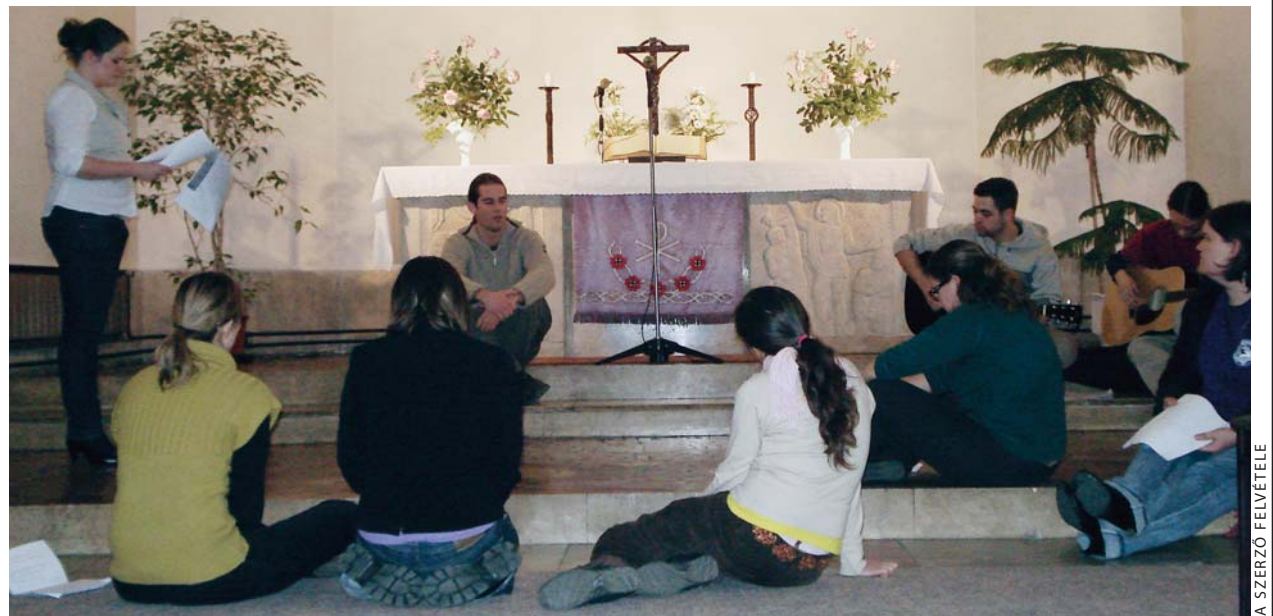
Passiójáték-próba teológushallgató módra

Közben lassan szállingóznak a többiek. Amíg szabadabbá nem válik a teológia tőszomszédságában lévő zuglói templom, a tényleges próba helyszíne, még itt, a kápolnában gyakorolják a zenei betéteket. Odát természetesen a szöveges-párbeszéd részeket sem hagyják ki. Időnként érezni némi feszültséget a leve-