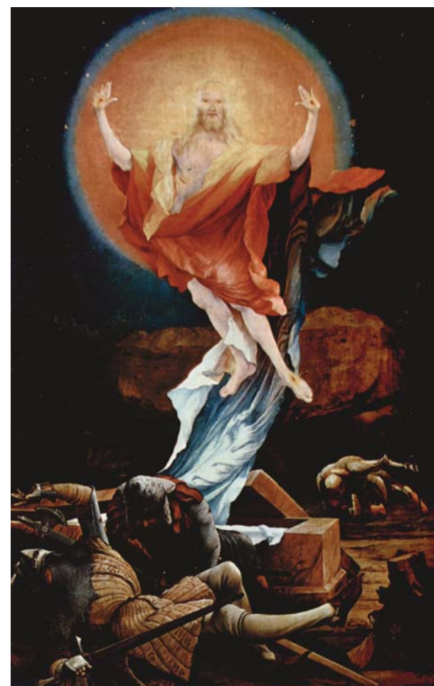
MATTHIAS GRÜNEWALD: ISENHEIMI OLTÁRKEP

S ami a legfontosabb, a szeretettől és örömtől ragyogó arca szinte vonzza a tekintetet, és üzeni: „Ne félj, mert megváltottalak, neveden szólítottalak, enyém vagy!”