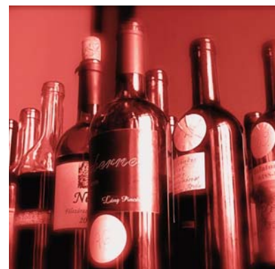
87-féle bort bíráltak

eljöjjön, hisz maga helyett munkást kell fogadnia – mégsem tudja megtenni, hogy otthon maradjon, mert Révfülöp nélkül nem telhet el egy év.