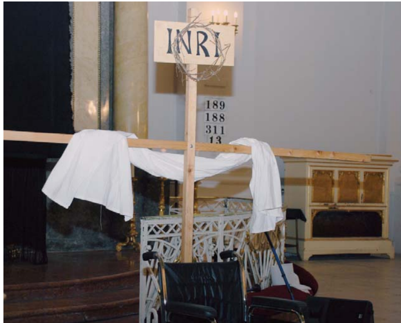
A 2008-as Bárka-passió záróképe

A bárkások – a néhai evangélikus lelkész, Andorka Eszter kezdeményezésére – 2003 óta járják, mindig változó összetételben, virágvasárnaptól nagypéntekig az országot (idén a Somogy-Zalai Egyházmegyé), és mutatják be Jézus szenvedéstörténetét, nem titkoltan azzal a szándékkal is, hogy elősegítsék a sérült emberek elfogadtatását. Azért is különösen fontos a szervezet életében a „passiózás”, mert ez a Mevisz-Bárka egyetlen olyan tevékenysége,