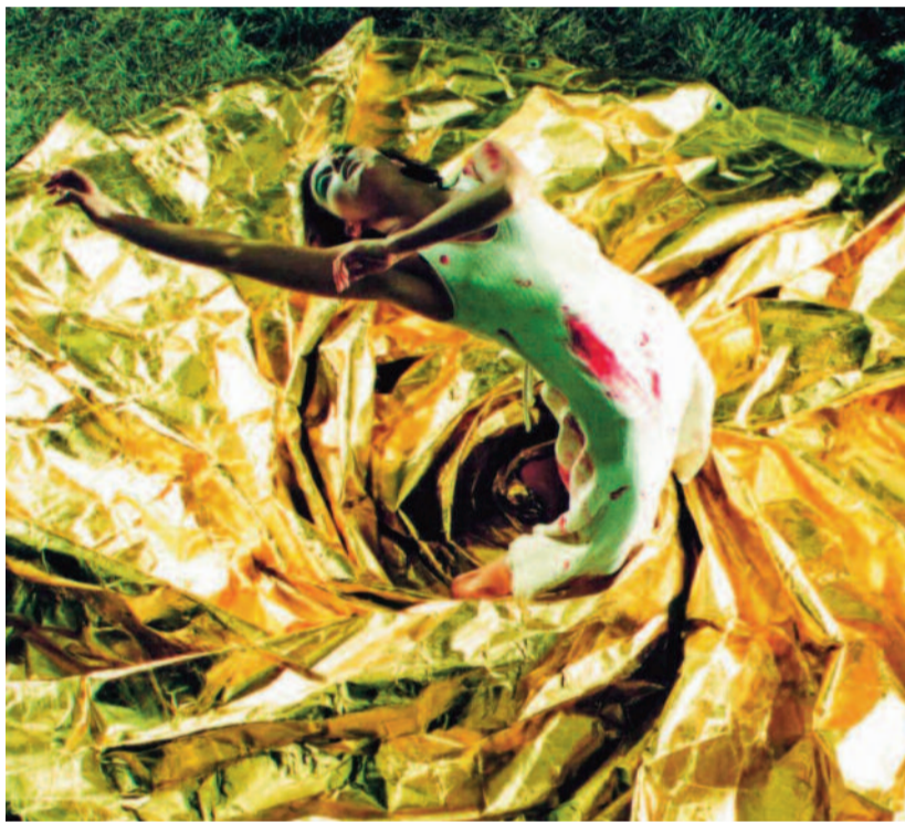
Pillanatfelvétel a Carmina Burana szegedi előadásából

zi zene kutatásában ért el eredményeket, emellett ma is világszerte alkalmazzák „Orff-Schulwerk” néven ismert zenei és mozgásnevelési metodikáját. Ebben – a gyermekek fejlődését is kiválóan szolgáló – pedagógiai módszerben a beszéd, a zene, a tánc ritmusa egygyé válik.