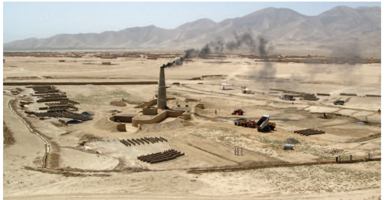
Téglagyár – „nem alamizsnát osztottunk közöttük, hanem munkalehetőséget teremtettünk nekik”

– Előfordult, hogy az irodánktól néhány utcányira lévő börtönből megszökött néhány rab, és az üldözésük közben lövöldözés tört ki a környékünkön, de olyan atrocitás, amely kifejezetten a segélyszervezet ellen irányult volna, mind ez idáig nem volt. A legtöbb támadás célpontja a katonaság és a rendőrség; nemcsak ezért,