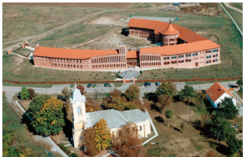
Archív légi felvétel az épülő aszódi evangélikus gimnáziumról