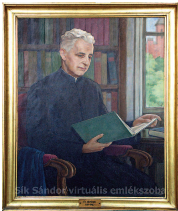
Sík Sándor virtuális emlékszoba