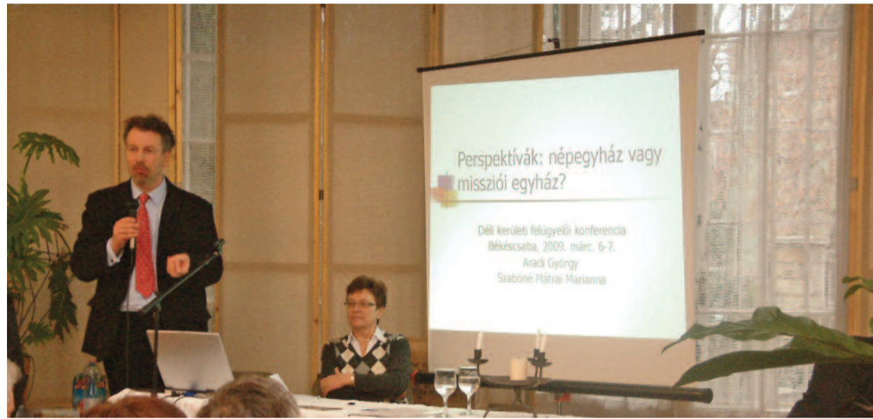
A szerzők a március 6–7-én Békéscsabán tartott felügyelői konferencián

tünkben, például a kereszténységgel kapcsolatos megdöbbentő mélységű tudatlanság átélésében.