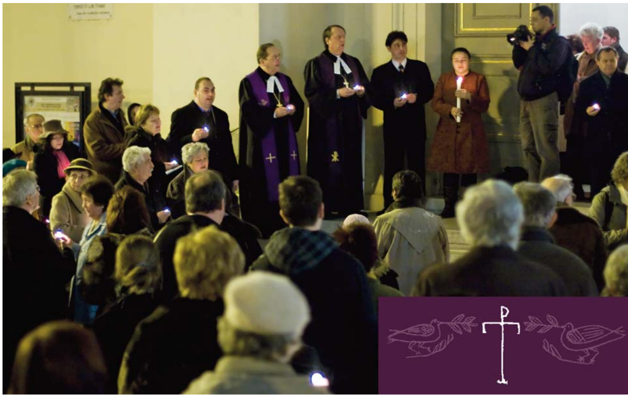
Apró mécsesekkel a kezükben léptek ki a Deák téri evangélikus templom kapuján a március 3-ai együttlétt résztvevői. A „Ne győzzön le téged a rossz, hanem te győzd le a rosszat a jóval!” (Róm 12,21) mottó jegyében meghirdetett esti alkalom az egyre jobban elharapódzó erőszak ellen kívánt csendesen tiltakozni. (Gáncs Péter püspök igehirdetése lapunk 3. oldalán olvasható.)

Oltalmat találni ► 5. oldal Irányváltás – mai megtérések ► 6. oldal Adáshiba Pestszentlőrincen ► 7. oldal A holland akció ► 8. oldal Ákos az evangélikus gimiben ► 12. oldal Böjti önvizsgálat ► 12. oldal