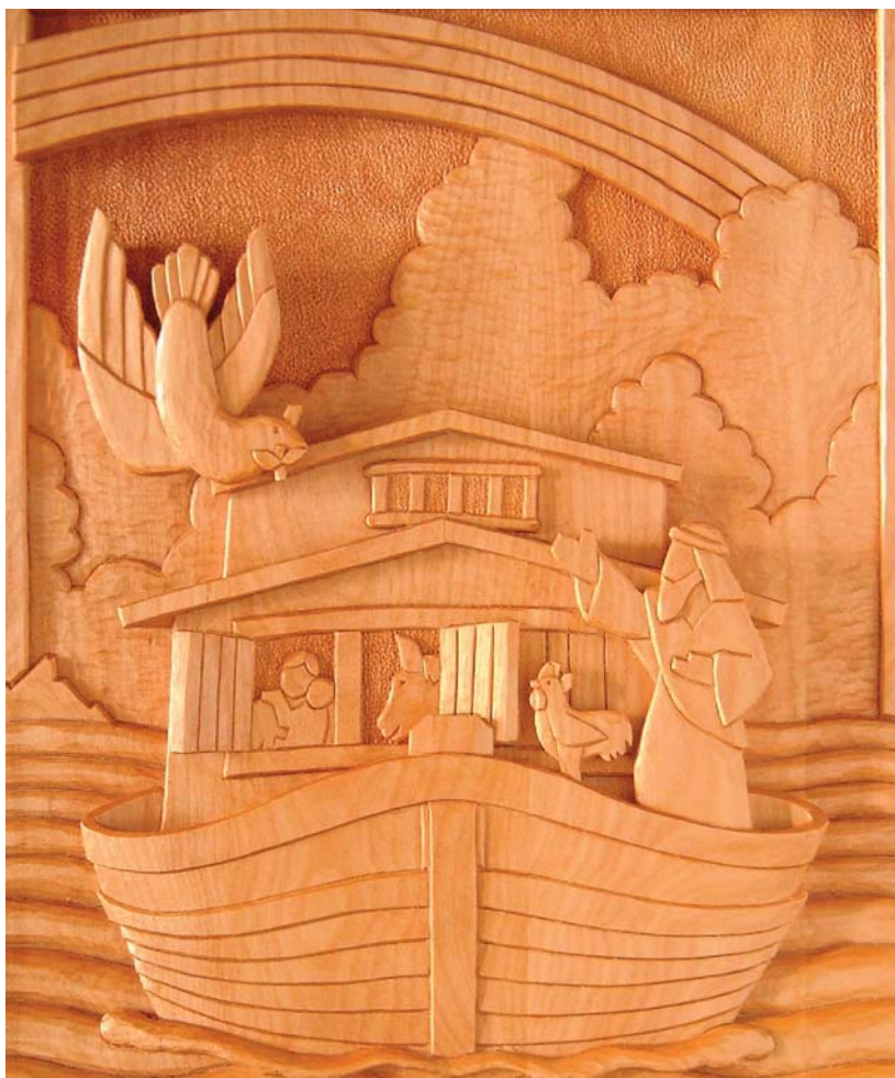
Örök téma (1) – ismeretlen művész metszete

1953-ban feljutott egy francia kutató a bárkáig, meg is találta, állítólag mélyen a jég alatt. Pár év múlva visszatért, és sikerült kioperálnia néhány fadarabkát a hajóból. Ezt elküldte egy laboratóriumba, ahol megállapították, hogy megkövesedett fáról van szó, amely ötezer évvel ezelőtt valahol a Közel-Keleten nőtt (tehát az Ararától minimum ezer kilométeres távolságra). A század vége felé a kutatók egy csoportja arra a „hivatalos” álláspontra jutott, hogy Noé hajója az Ararát oldalában található, az egyik földrengésben kettétörtött,