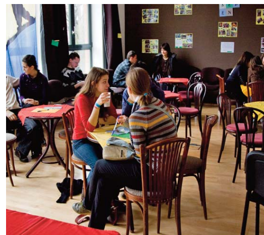
Nosztalgizálás Kőszegről a KIE-kávéházban

A jövő évi találkozó házigazdájának azt üzenik: ugyan sok munkával jár a szervezés, de nagyon jó érzés otthont adni a Szélrózsának. És ne izguljanak, mert ahogyan ők is folyamatosan érezték mások támogatását, úgy biztosan nekik is segítenek majd.