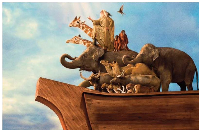
Örök téma (2) – az Evan, a mindenható című film plakátja

A magyarázat abban rejlik, hogy a sarkvidéki jég a felmelegedés hatására olvadni kezdett, emiatt megemelkedett a világtengerek vízszintje, így a Földközi-tengeré is. Egy idő után azonban a Boszporusz földhíd-