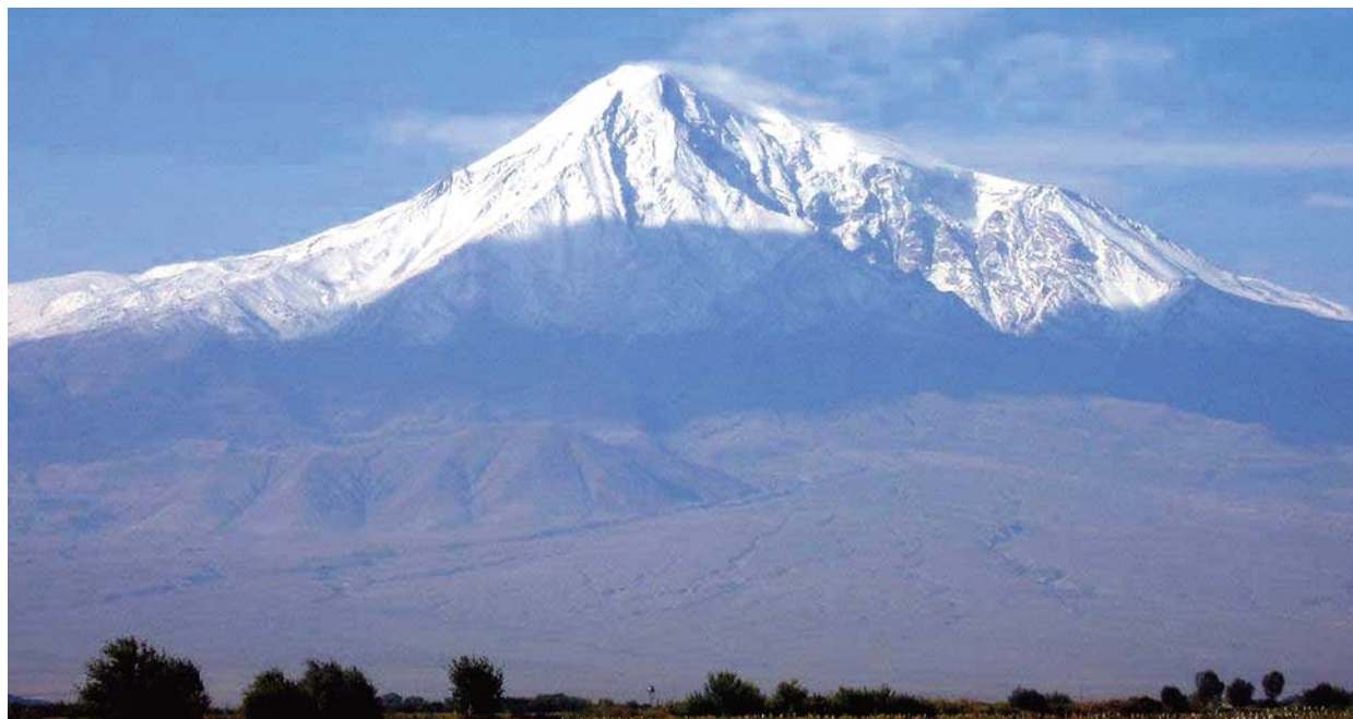
Az Ararát hófödte csúcsa

▶ A bibliai „tudósítás” mellett szinte a világon számtalan nép mesél egy mindent elsöprő özönvízről. Ez vajon azt jelenti, hogy csakugyan megnyíltak egykoron az ég csatornái, és az egész földet elborították a hullámok? Az Ararát környékén terjedő legenda szerint a hegy oldalában, nem messze a csúcstól „csücsül” Noé bárkája a hóban. A múlt század közepén még számtalan szemtanú állította, hogy látta az akkor már hóval félig ellepett hajót. A kérdés nehéz, sokat vitatott, számtalan elmélet, elgondolás kering a témával kapcsolatban.