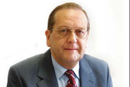
Jttész János püspök Nyugati (Dunántúli) Egyházkerület

Kedves olvasók, testvéreim! Nem kellene ennek így lennie, hiszen megjelent az Isten Fia, hogy lerontsa az ördög munkáit – bennünk is.