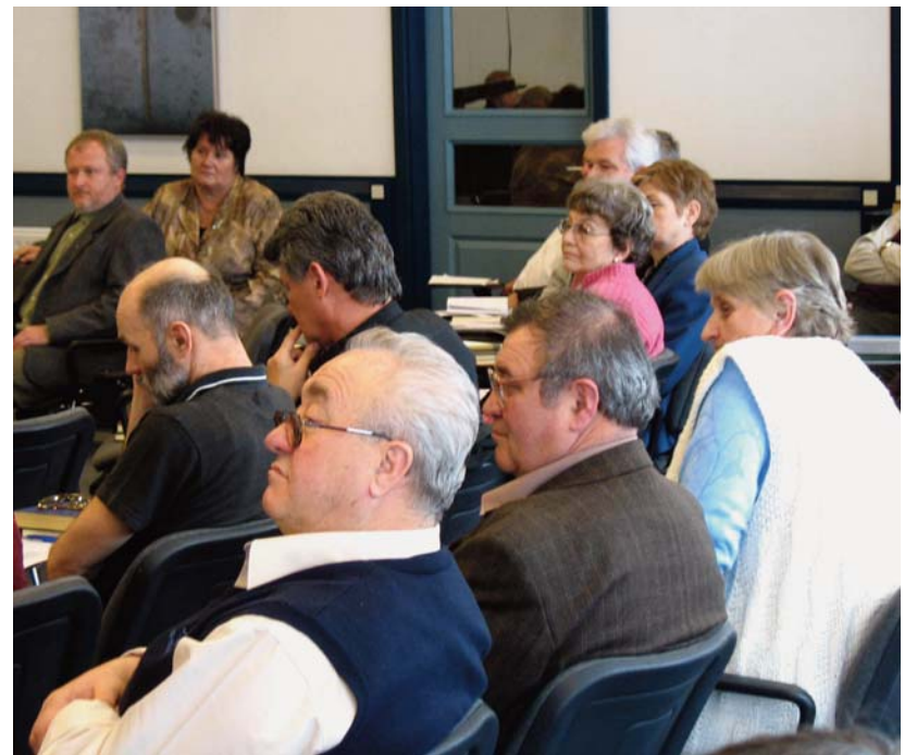
A résztvevők egy csoportja

Írásunk a révfülöpi presbiteri továbbképzés február 28-án elhangzott előadásának szerkesztett változata