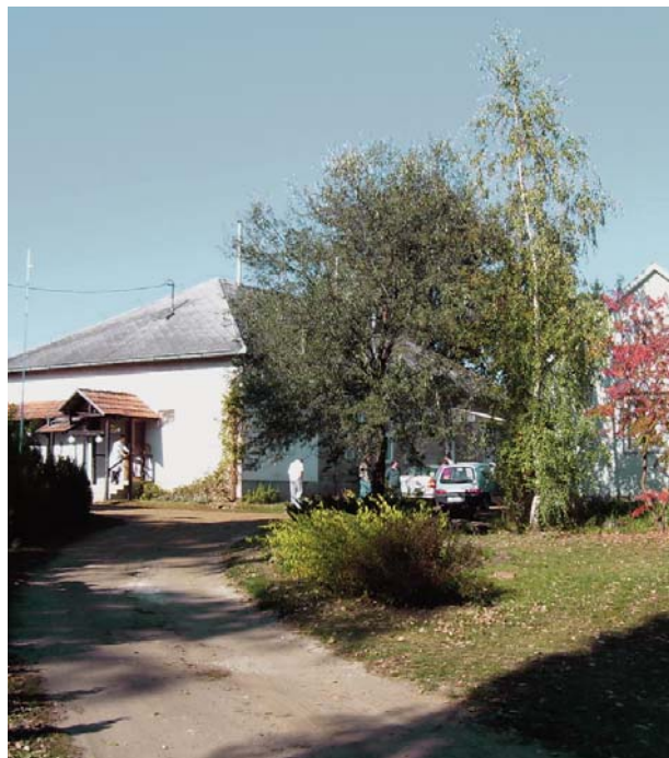
A Joób Olivér Szeretintézmény – és ellátási területének egyik bokortanyája

A városrészhez huszónhét bokortanya tartozik, ezekben mintegy két-