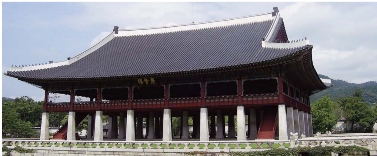
Korea hagyományos építészeti stílusát őrző szöuli kastély

Átgondolva tanításbeli különbségeinket és elkülönültségünk botrányos történelmét – sőt néha még a keresztények közötti gyűlöletet is – imádkozunk, hogy Isten, aki Lelkét leheli a száraz csontokra, és aki kezében formálja egységünket különbözőségeink közepette, életet és megbékélést leheljen kiszáradt életünkbe és megosztottságunkra ma is.