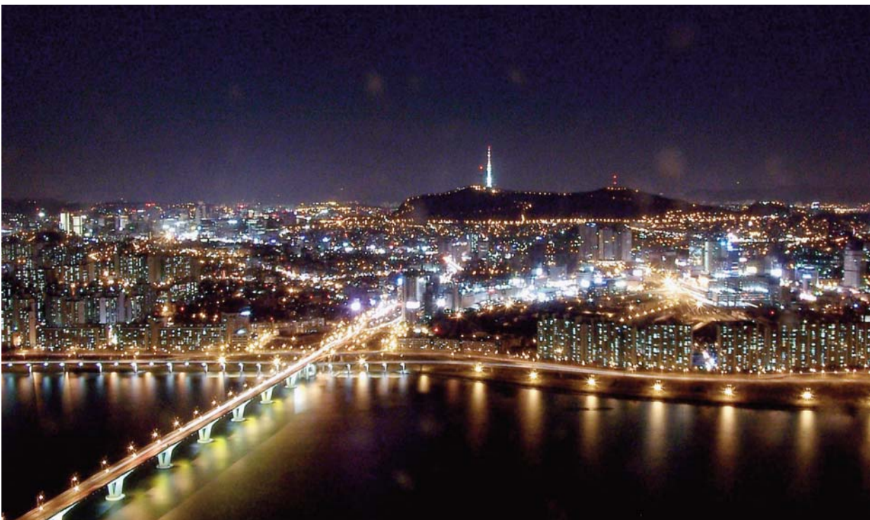
A Han folyó partja Dél-Korea fővárosában, Szöulban

A keresztényeknek türelmesen kell imádkozniuk, amíg az „új ég és új föld” el nem érkezik, és akkor így teljesül a próféta jövendölése: „Az én népem lesznek, én pedig Istenük leszek.” (Ez 37,23)