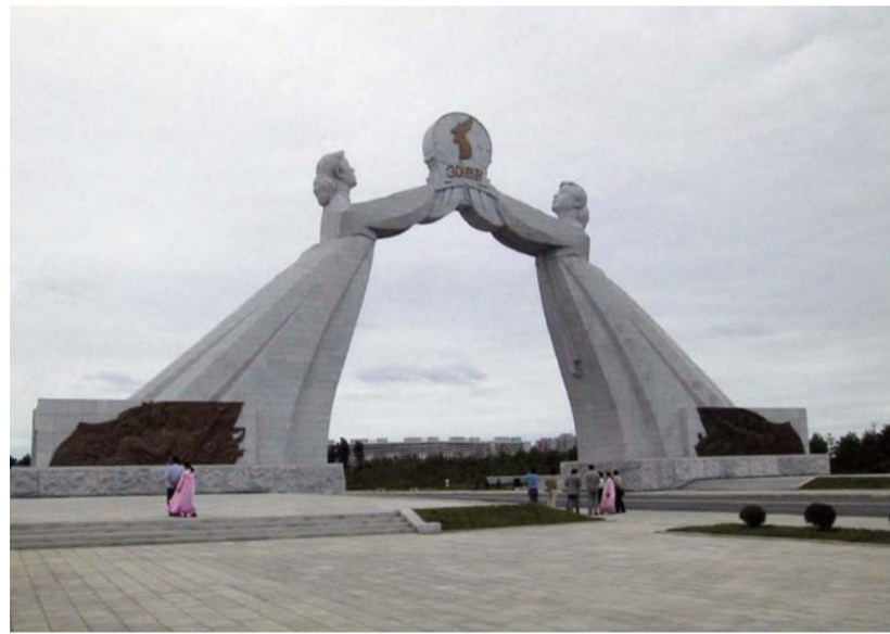
Az újraegyesítés phenjani emlékműve (Észak-Korea)

A koreai katolikus közösséget Lee Sung-Hun – az első megkeresztelt katolikus – alapította 1784-ben, aki elterjesztette a keresztény tanokat