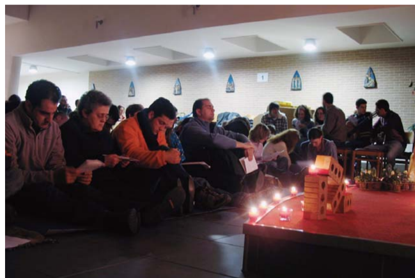
Szilveszteri virrasztás a résztvevőket fogadó templomok egyikében

egymást, építsék otthoni gyülekezeteik közösségét, és lépjenek át a társadalmakat megosztó válaszfalakat. Beszédében felhívta a figyelmet,