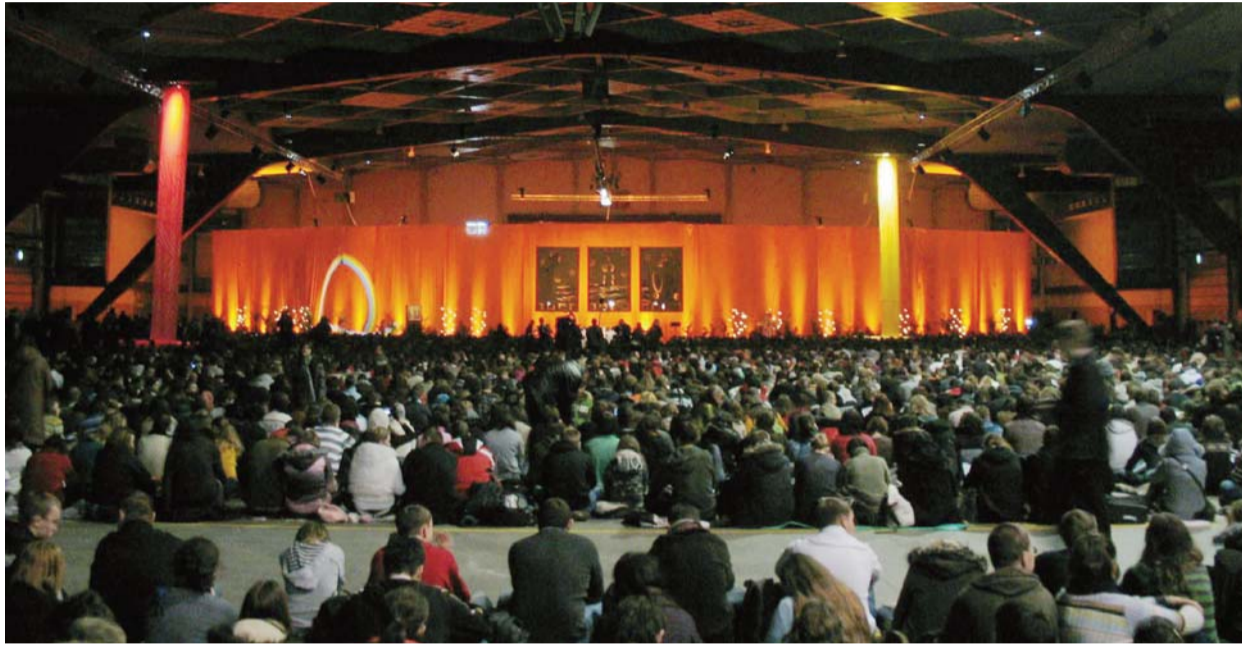
A bizalom ökumenikus zarándokútja – Brüsszel adott otthont december 29. és január 2. között a 31. Taizé-találkozónak ▶ Beszámolónk a 4. oldalon

Felkészítő összeállítás az ökumenikus imahétre ▶ 11–14. oldal