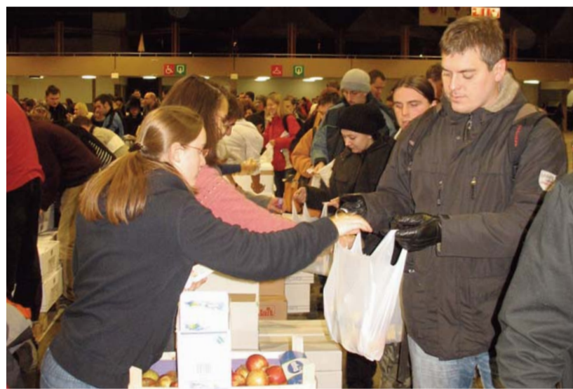
Ebédosztás fennakadások nélkül

hogy a gazdasági válság nehézségei közepette különösen fontos a szolidaritás példamutatása, a népek közötti kiengesztelődés, a nyomor és a háborúk elleni küzdelem.