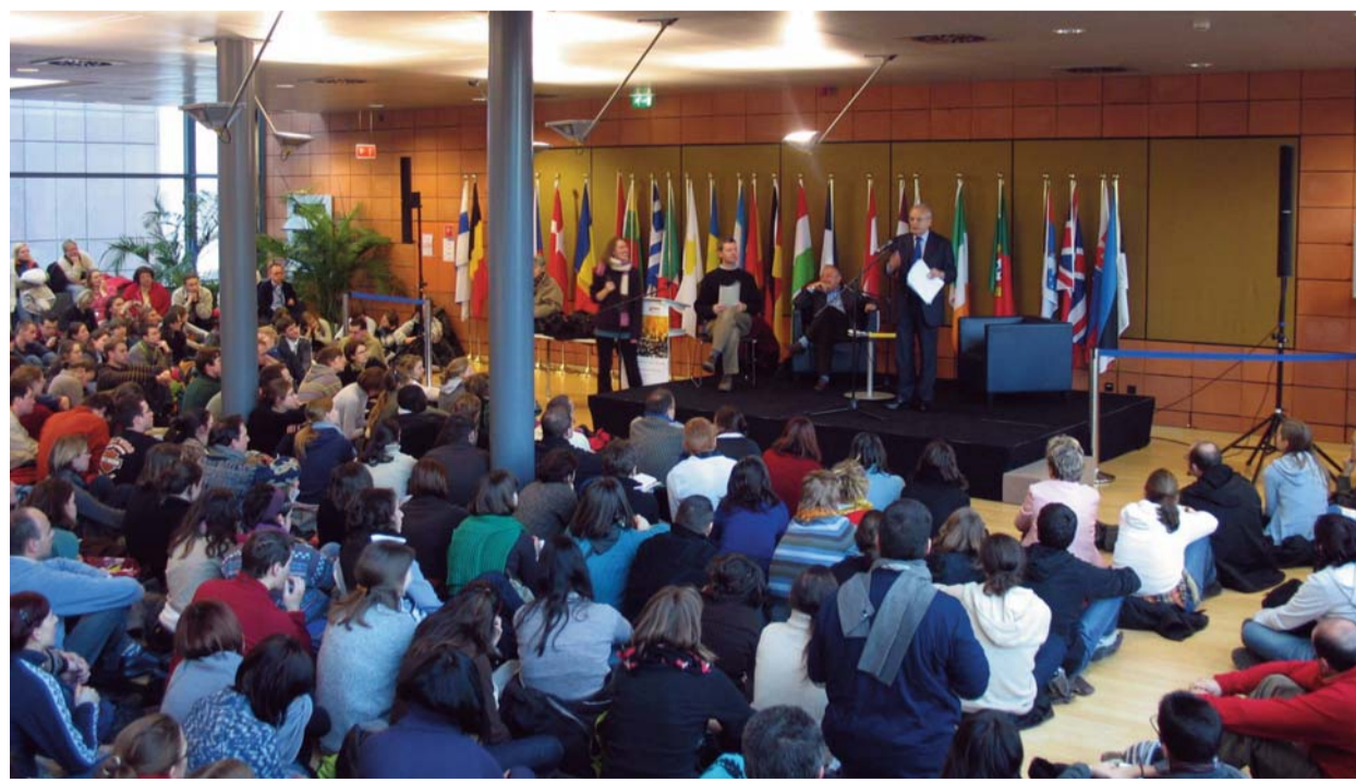
Jacques Barrot, az Európai Bizottság alelnöke előadást tart a Európai Gazdasági és Szociális Bizottság épületében