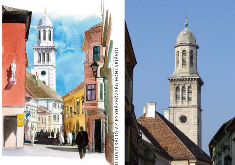
ILLUSZTRÁCIÓ AZ EGYHÁZKÖZSÉG HONLAPJÁRÓL