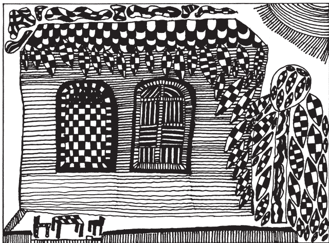
Dieter Fercher: Ház a kertben, 2000.

Az elmúlt években heves viták zajlottak ezekről a kérdésekről az egyházakon és a politikai mozgalmakon belül.