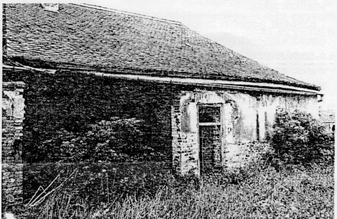
AZ ÓVODA ÉPÜLETE, MELY TELJES FELÚJÍTÁSRA SZORUL, RÉSZBEN JAVÍTOTT TETŐVEL. ITT IS SZÁLLÁSHELYEK LESZNEK A TETŐTÉRBE