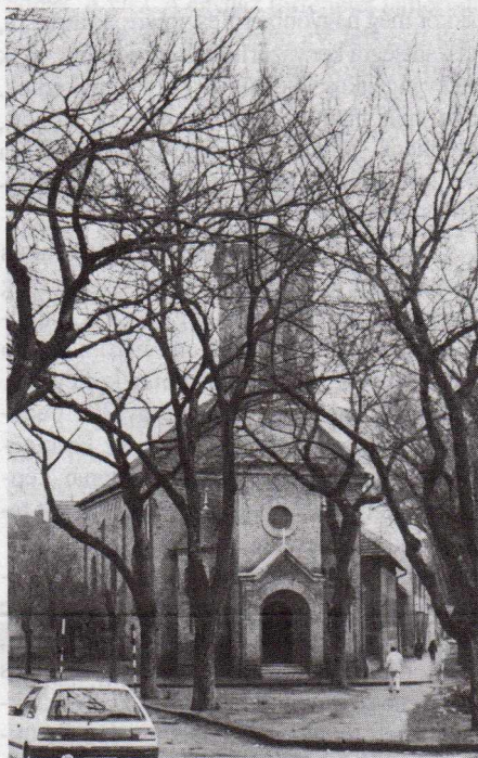
A szabadkai evangélikus templom

s itt gondolok a németajkú evangélikusokra is, akik eddig még nemzeti kisebbségként sem szerepeltek, s most várják státusuk elismerését. Minden valószínűség szerint a magyarság köréből is egyre többen fognak majd jelentkezni, ugyanis sokan keresnek lelki kárpótlást. Az evangélikus egyház egyetlen tekintélye a Szentírás, amely eliga-