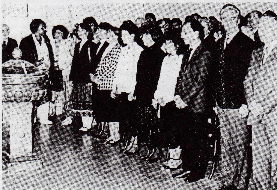
A fasori tanári kar eskütétel előtt