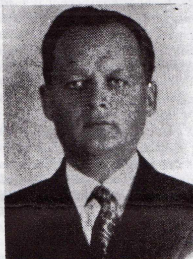
Ruzsa István (1883—1940)

Az Amerikába került magyarok főleg a keleti országrészek bányáiban vagy az ottani nagyvárosok ipari üzemeiben kaptak munkát, bár otthon többségük földműveléssel foglalkozott. Így már a századforduló körül az ohioi Cleveland városában több magyar élt, mint sok magyarországi vidéki városban. Mivel ezek legtöbbször