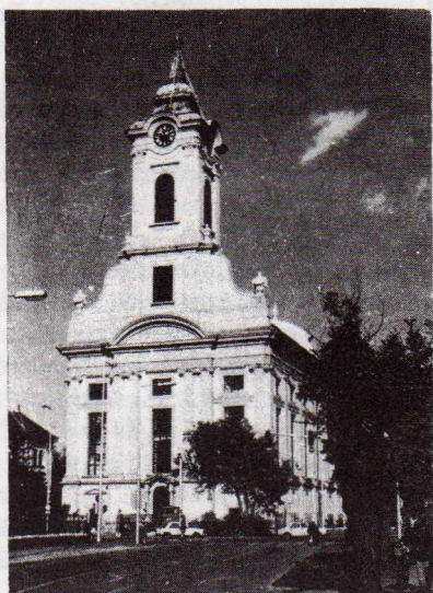
A békéscsabai nagytemplom

Ezért ma már az intézményes megújulás első jelei nyilvánulnak meg az evangélikus egyházi életben. E jelek közé sorolhatjuk, hogy újra növekvő számban iratkoznak be hívó fiatalok a teológiai akadémiára, hogy a lelkészi hivatásra felkészüljenek. Következésképpen el kellett határozni a teológiai fakultás épületeinek a megkésztetését, hogy az a jelenlegi hetven tanuló befogadására alkalmas legyen. Az építkezési munkák, amelyek költ-