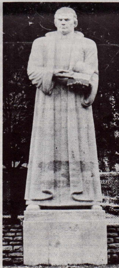
A budapesti Luther szobor.

A gyülekezeti megmozdulások is sokrétűek voltak. A szokásos reformációi ünnepélyeken és istentiszteleteken felül a jubileumi lelkesedés sokhelyütt meglepő eredménnyel