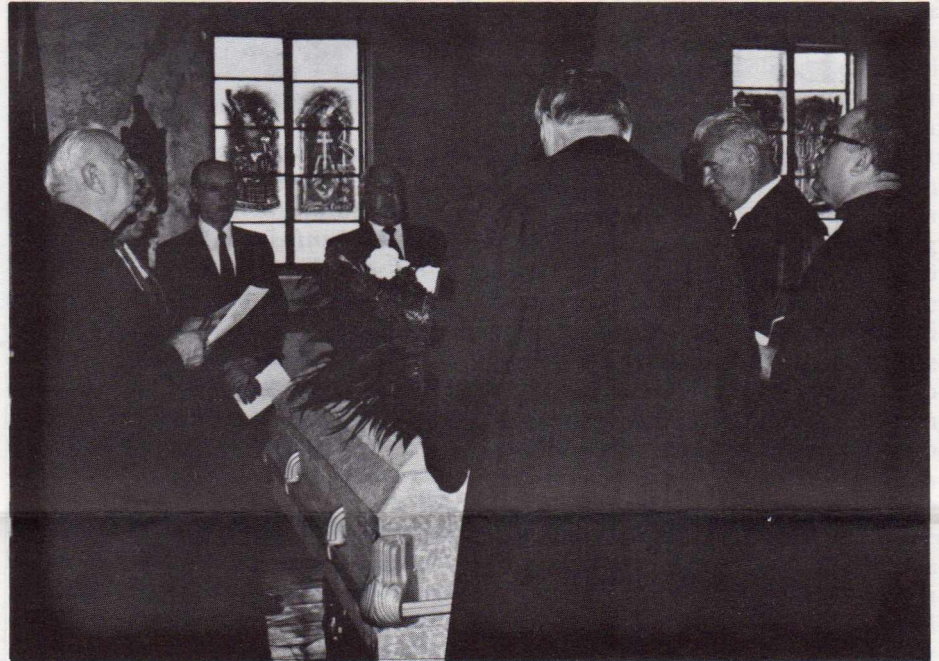
A koporsót körülálló lelkésztársak búcsúéneke.