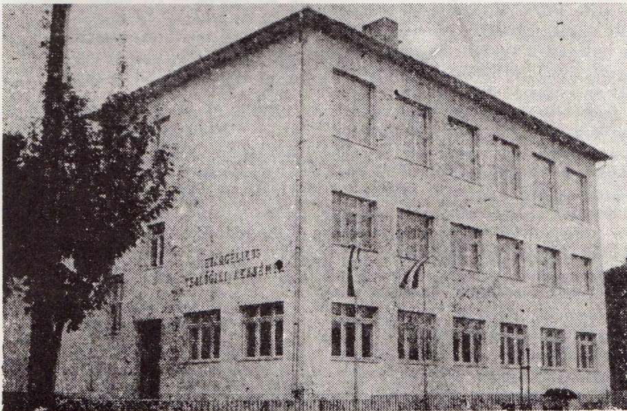
Az új budapesti Evangélikus Teológiai Akadémia és Teológus Otthon homlokzata. Szeptember 25-én világraszóló háladási ünnep keretében avatta fel hazai

A legfontosabb és a legnehezebb szócska itt: a “szent” egyház. Szent nem azt jelenti, amit általában érte-