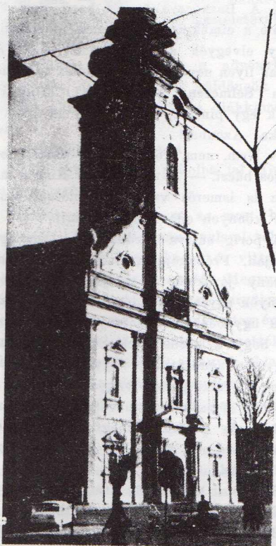
A nyíregyházi evangélikus műemlék templom

volt, egeret, patkányt űztek el vele. Másutt a gazdaasszonyoknak kellett meztelenül körülszaladni az egész házat s közben a következőket mormolni: "Egerek, patkányok, menjtek oda, ahol fényt láttok!" Ezért nagycsütörtökön sehol se gyújtottak világot, hanem ki-ki sötétben végezte házi munkáját.