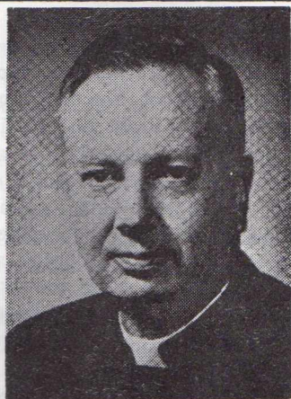
FRANKLIN CLARK FRY