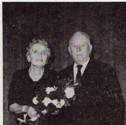
Az ünnepelt házaspár: