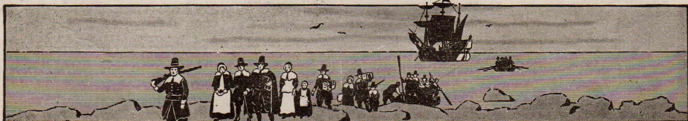
A "Pilgrim"-ek megérkezése Amerikába 1620-ik évben