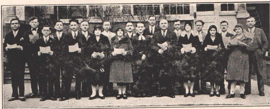
A windsori gyülekezet vegyeskara.

likus magyar Kanadában és az Egyesült Államokban egyaránt azon dolgozni, hogy a magyar névnek becsületet szerezzenek. A magyar evangélikus névnek pedig csak úgy szerezhetnek becsületet, ha egyházaikban lel-