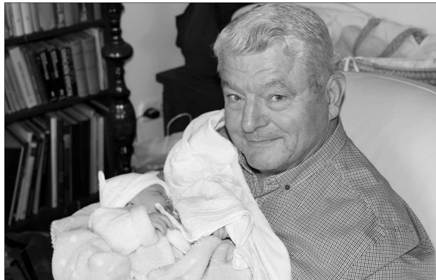
A Szerző 12 napos 12. unokájával karácsonykor.

2018-ban is olvassa a Dunántúli Harangszót!