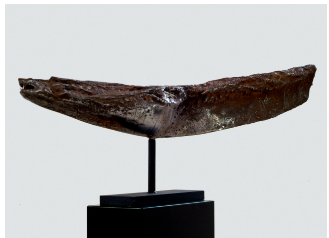
Lestyan-Goda János: Vasharcsa