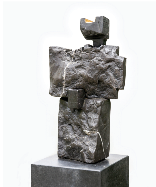
Kling József: Kultikus szobor