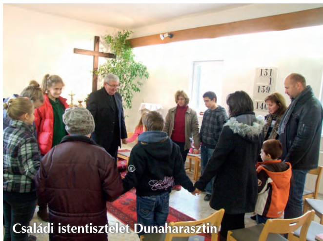
Családi istentisztelet Dunaharasztin