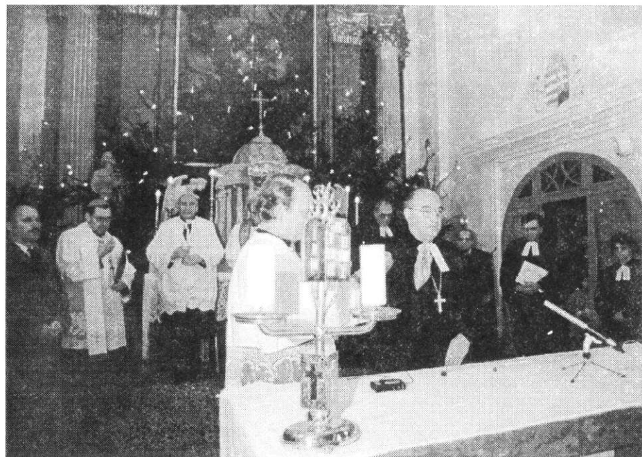
D. Szebik Imre püspök áldást oszt