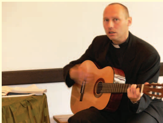
A gitár is előkerül a lazább, gyermekközpontú családi istentiszteleteken.