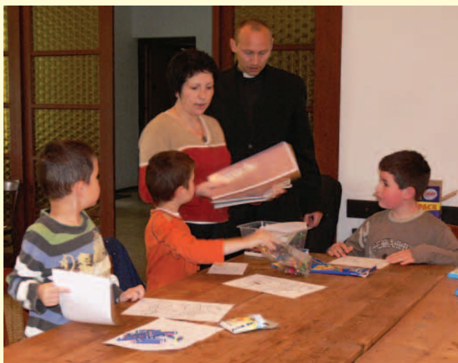
Az alkalmakon fel lehet fedezni az alkotás örömét is a kézműves foglalkozáson.