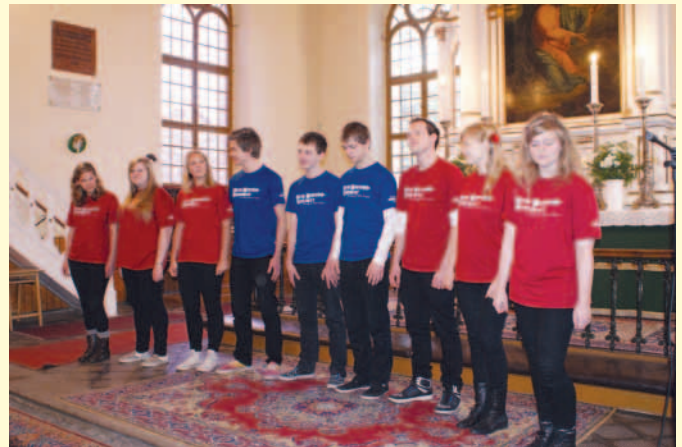
November 17-én az áhítat keretében fellépett a norvég TEN SING együttes, amely a békéscsabai Keresztyén Ifjúsági Egyesület vendégeként tartózkodott városunkban.