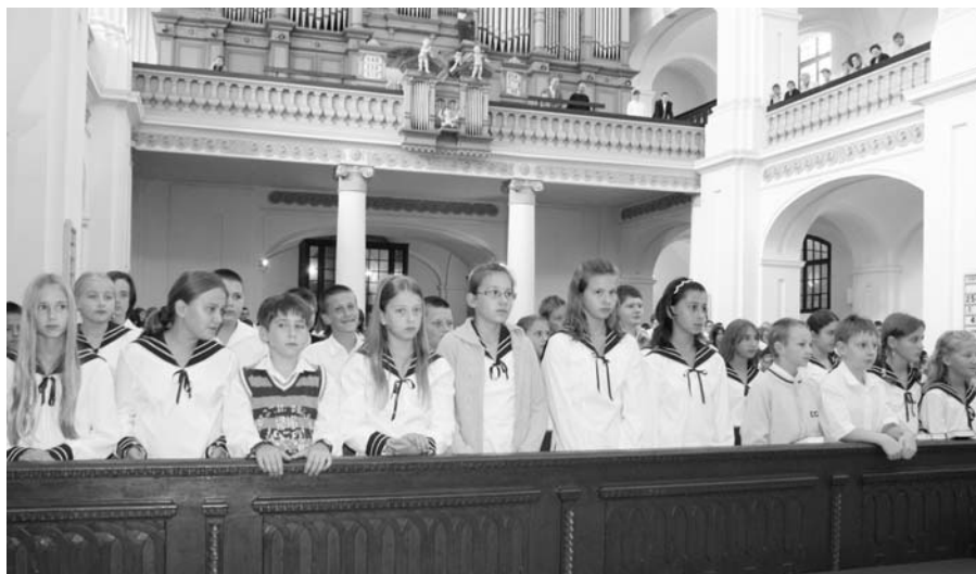
2009. szeptember 1-jén 59 ötödik osztályos és 151 kilencedikes diák kezdte meg tanulmányait a gimnáziumban.