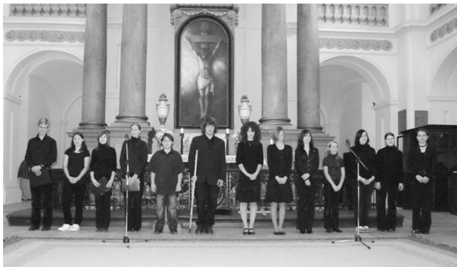
A gimnáziumban a hagyományoknak megfelelően idén is ünnepi műsorral emlékeztek meg a 160 éve kivégzett 13 aradi vértanúról.