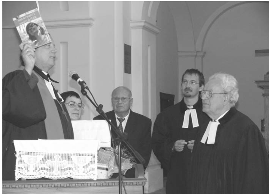
Gáncs Péter püspök (balra) ajándékot ad át a nyugalmazott lelkésznek

A nyugalomba vonuló lelkész Máté evangéliuma (6,24-34, a gazdag ifjú példázata) alapján hirdetett ígét. „Hűség és bizalom – ez keresztény életünk két kulcsszava. Isten az, Aki egy életen át hű hozzánk, Ő a bizalom forrása. Naponta erre tanít, és az első bűneset óta az embernek ez a tartozása Isten felé. Sajnos az emberiség története a hűtlenség és a bizalomvesztés története” – hangzott el. Későbbiekben szökött arról, hogy a keresztény élet választás elé állít mindenkit: Isten vagy mammon. Nem lehet két úrnak szolgálni, Ő nem osztozik senkivel. Isten élő Úr, a pénz halott tárgy. Mégis akik csak a mammont imádják, tisztességesebbek, mint a kétfelé sántikálók, akik istentelen bálványimádó paráznák. Dönteni kell – még ma!