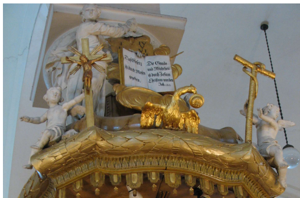
„A törvény Mózes által adatott, a kegyelem és az igazság Jézus Krisztus által jött el.” (Jn 1,17)

Ha már elfogadtad Krisztust mint üdvösséged alapját és velejét, akkor következik a második pont, hogy példát végy róla, s úgy szenteld magad felebarátod szolgálatára, ahogyan – mint látod – ő neked szentelte magát. Lásd, ettől kap