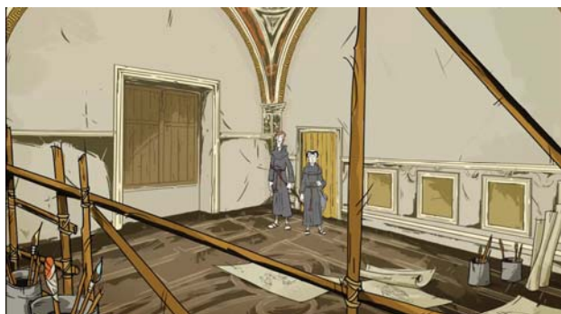
Reformációi lapszámunkban szereplő grafikák Richly Zsolt Luther-rajzfilmsorozatának „Úton az Úr felé” című 4. epizódjából valók.