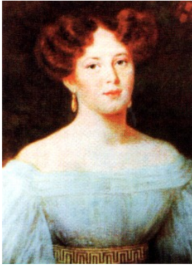
Mária Dorottya (Lujza Vilma Karolina) würtembergi főhercegnő (1797–1855)

Sorozatunk előző részében a pietizmus egyik legjellegesebb magyar születésű képviselőjével, Petrőczy Kata Szidóniával foglalkoztunk, most pedig e lelki-ségi mozgalom egyik német származású tagjával fogunk megismerkedni.