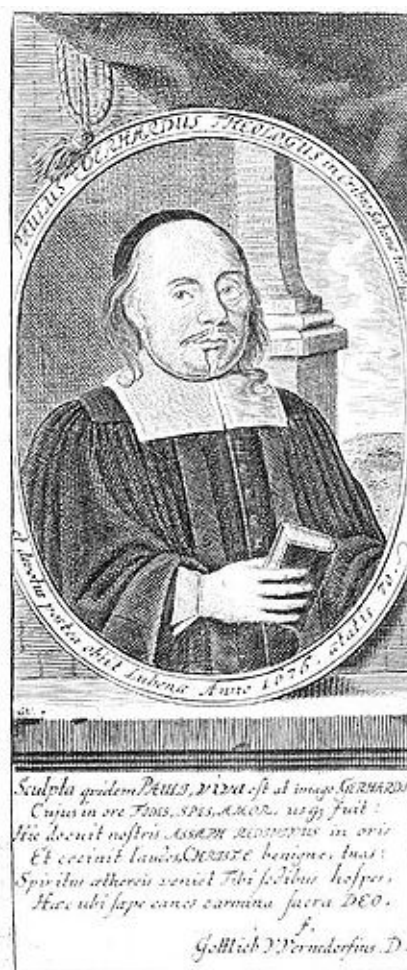
Paul Gerhardt, 17. századi rézmetszet