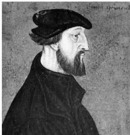
Simon Grynaeus (gouache, papíron, 1530/1550)

Mindenek előtt köszönetet mondok a lehetőségért, hogy a Budavári Hírmondóban is beszámolhatok a Simon Grynaeusszal (1494/95–1541) kapcsolatos kutatásaimról.