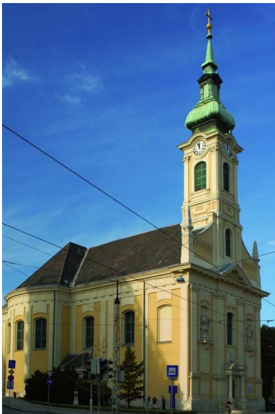
Krisztinavárosi Havas Boldogasszony katolikus templom