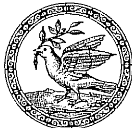
Galamb olajággal. Schmid: Mímtakönyv

Az első országos hittanversenyük után ők is elmondhatják: Jöttünk, láttunk, (tudtunk), győztünk – Istennek legyen hála!