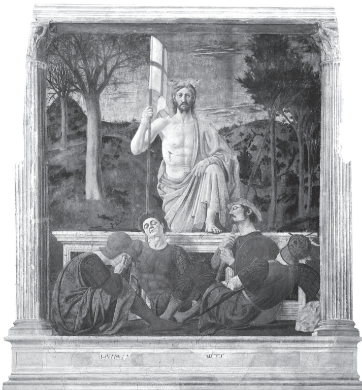
Jézus Krisztus feltámadása Piero della Francesca (1416–1492) Museo Civico di Sansepolcro (Assisi megye, Olaszország)