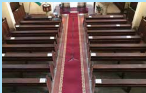
Ültetési rend az újra látogatható istentiszteleteken

Május 24-től a legújabb kormányrendeletek értelmében, valamint a püspöki tanács ajánlása alapján újra nyilvános istentiszteletet tarthatunk templomunkban, a nyitással kapcsolatos fontos tudnivalók a Védekezési Szabályzatunkban elérhető a honlapon, illetve a templomban is kifüggesztjük.