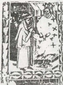
Képet a tolmács-legendáról a csanádi egyházmegye Szent Gellért, hogy az magyar nyelven tanít.

általánosabb igazságot is hordoz: Tolmács, ne hazudj!