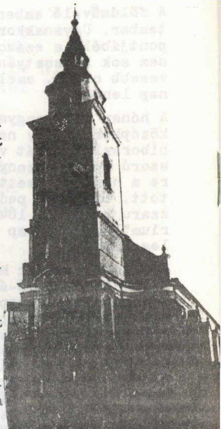
Beregszász. A református templom

"Boldogok a halottak akik az Úrban hálnak meg, mostantól fogva. Bizony, ezt mondja a Lélek, mert megnyugszanak fáradozásaiktól, mert cselekedeteik követik őket - és maga az Isten lesz velük, és letörlől minden könnyet a szemükről, és halál sem lesz többé, sem gyász, sem jajkiáltás, sem fájdalom nem lesz többé! Ámen." (Jelenések könyve)