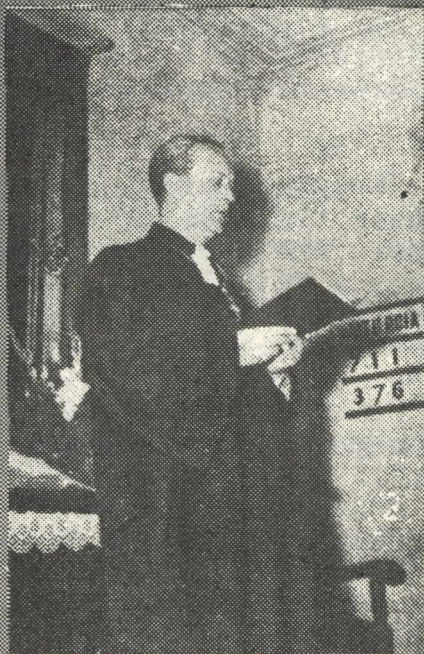
Dr. Ordass Lajos püspök első Isteniszélete Hudahegyvidéken rehabilitációja után

Főtiszteletendő Dr. Ordass Lajos püspök úr 1978. augusztus 14.-én lelkét vissza adta Teremtőjének!