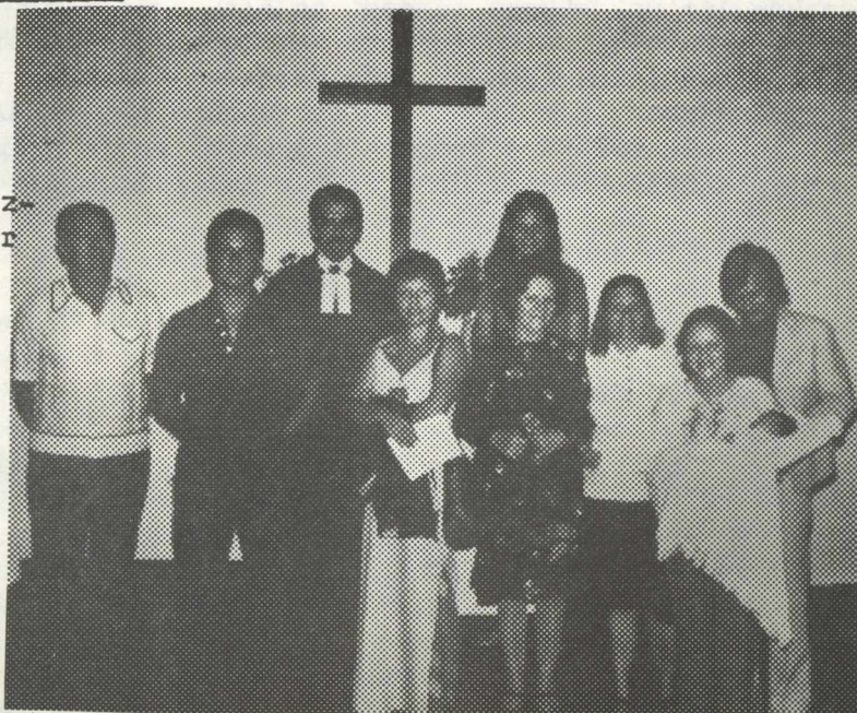
Az istentisztelet magyar résztvevői. 1975.