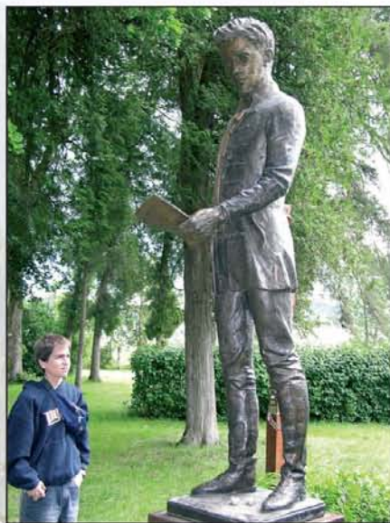
Egy fiúcska Petőfi Sándor néhány éve felállított szobránál; Segesvár mellett, ahol a nemzet költője elesett