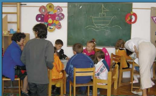
Gyermekfoglalkozás az egyházközség óvodájában