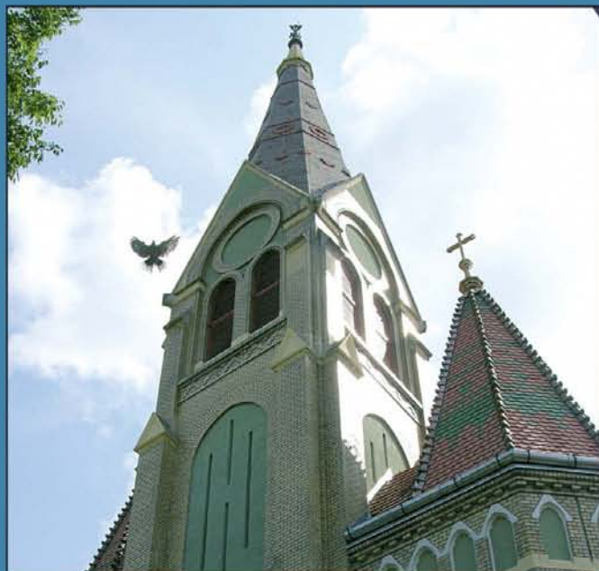
A nagyváradai evangélikus templom tornya galambbal