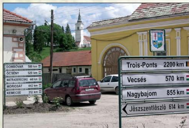
Ők ennyire számoltartanak minket...