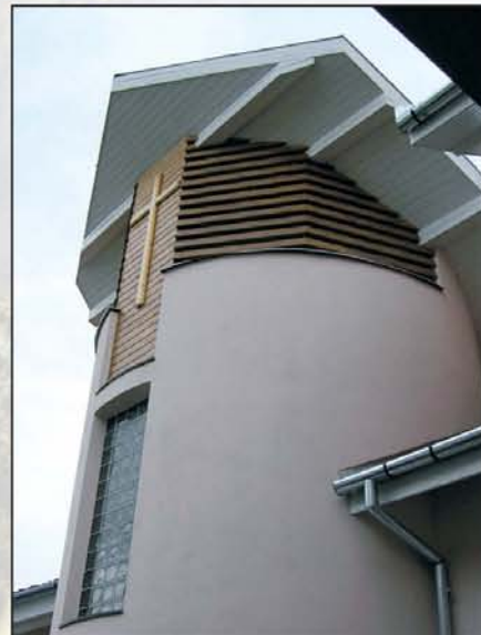
A nagy csíkszeredai katolikus tengerben él kétszáz evangélikus. Számukra épül a templom. Reméljük, lesz idén szentelés.