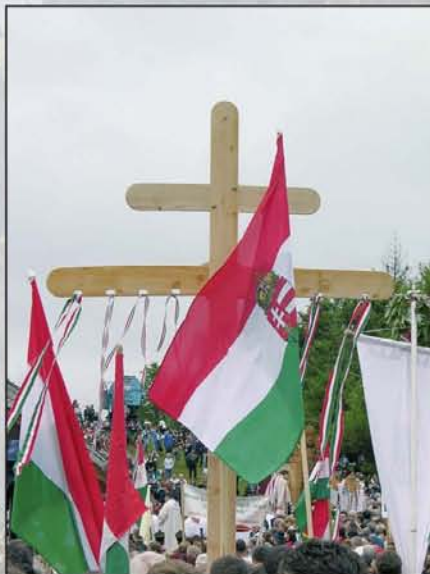
Isten, áldd meg a magyart!