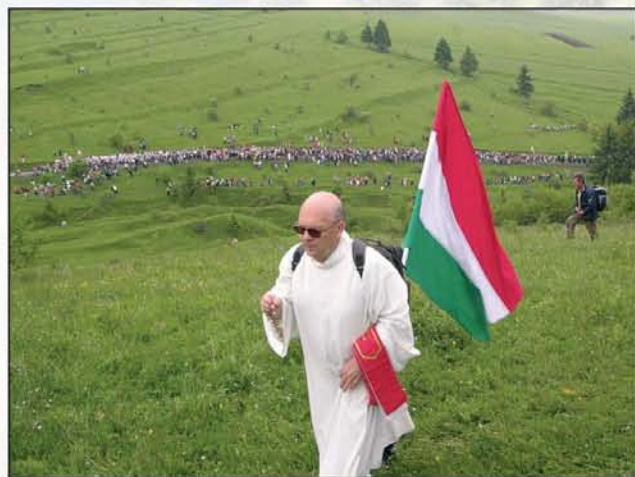
Ehhez nem kell kommentár