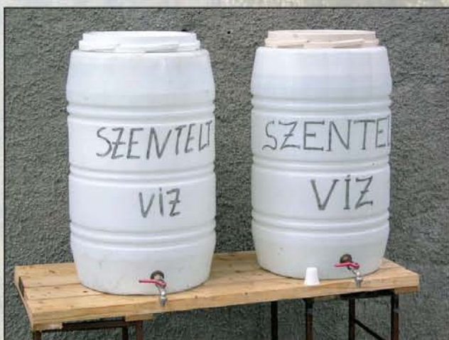
Ebből is volt bőségesen