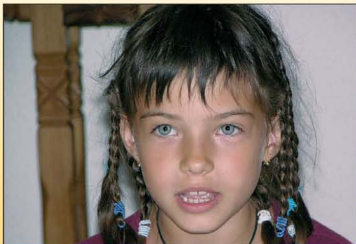
Istennek vele is terve van. A konferencián sok gyermek és fiatal résztvevő is volt.