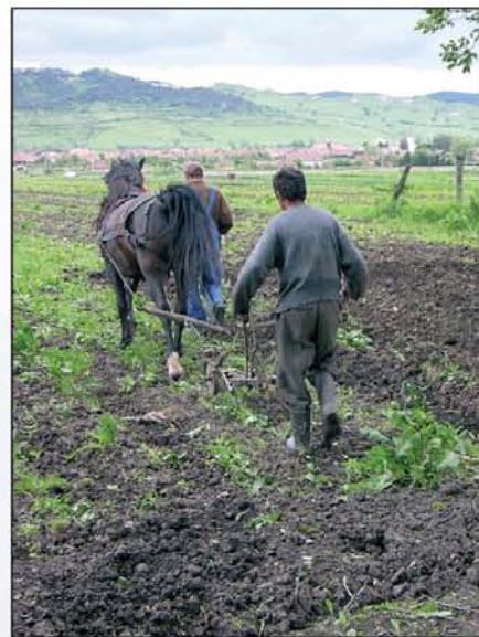
Szántás a volt csatatér közelében