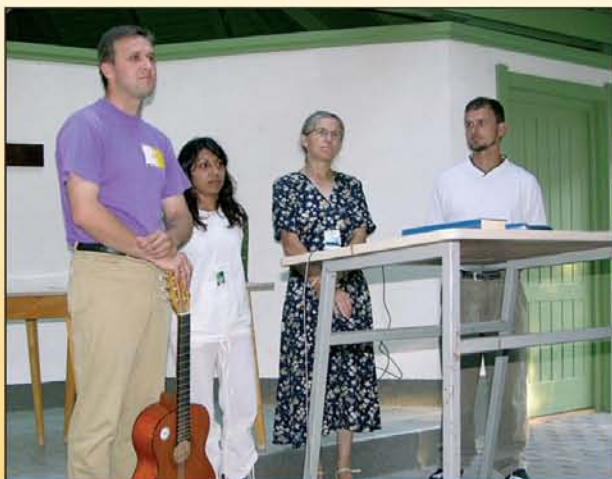
A kárpátaljaiak szolgálatán most is érezhető volt a Lélek kente. Isten hozta őket közénk.