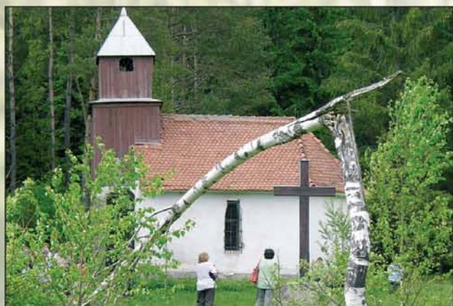
„Az ő sebei árán gyógyultunk meg.” (Ézs 53,5) Kis kápolna a Szent Anna-tónál