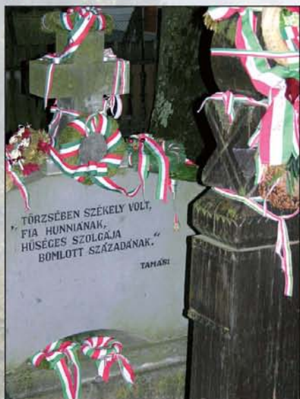
Tamási Áron sírja Farkaslakán