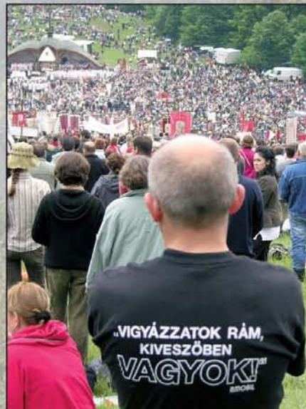
A kép címe a pólon olvasható