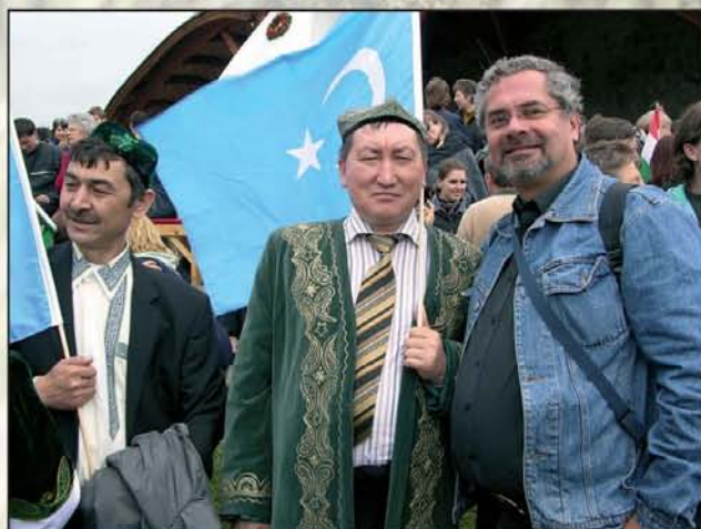
Óriási taps fogadta az ujjurokat, a Kínában élő távoli rokonainkat