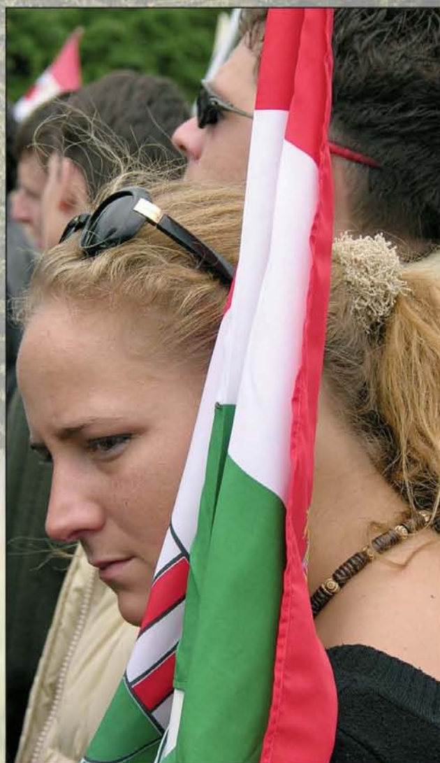
Nem mindenkit sodor magával a globalizáció