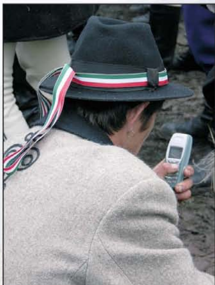
Székelyöldön is hatása van a modernizációnak: fülbevaló és mobil